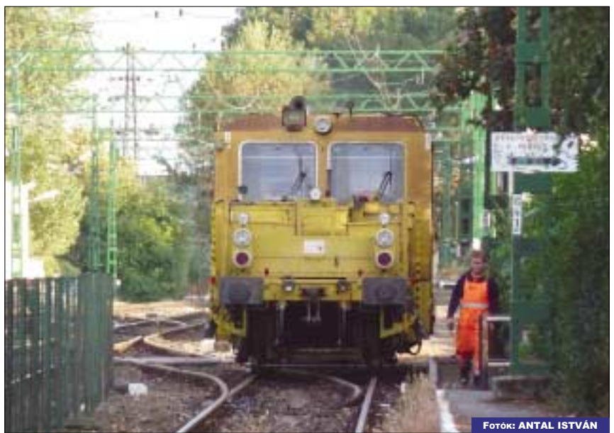
A szentendrei HÉV sínpályájának megerősítését végezték a szakemberek, ezért hetekig pótlóbuszok jártak hétfégen Békásmegyer és Szentendre között