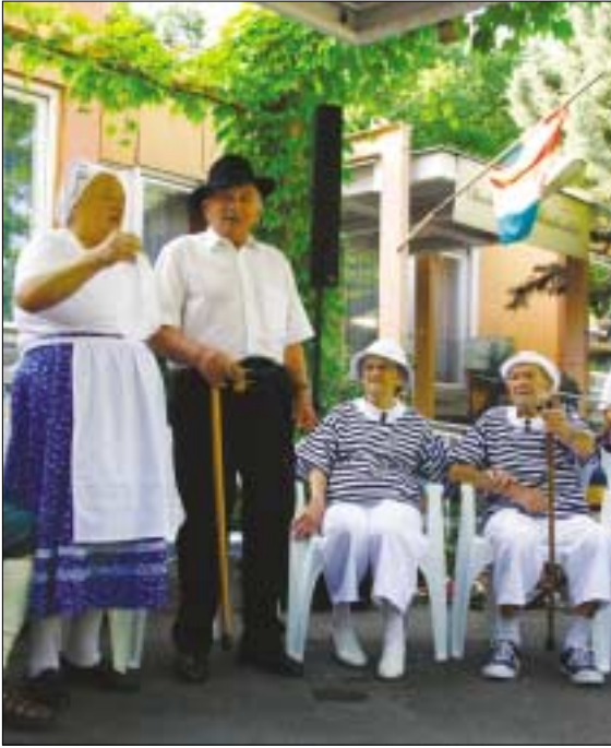
Hozzátartozói találkozót rendeztek nemrégiben a Derús Alkony Gondozóházban