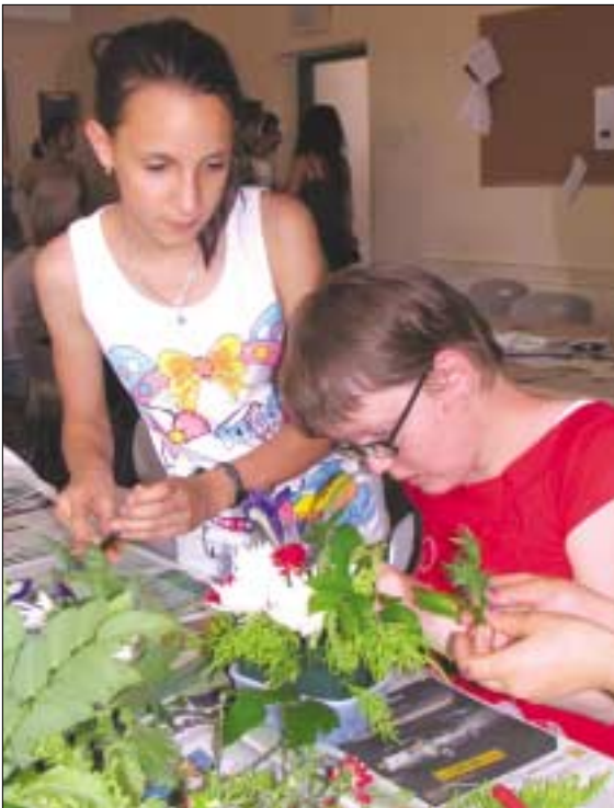
KAPCSOLDA. Az Óbudai Gimnázium által szervezett, fogyatékkal élő és egészséges tanulóknak rendezett programra a Keve-Kiserdei Általános Iskolából is érkeztek diákok