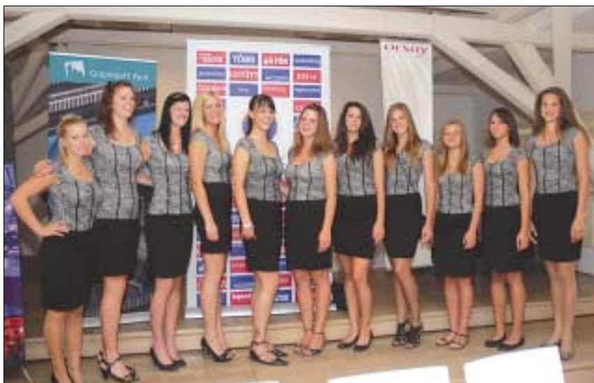
A 2011-2012-es bajnoki év új csapata elegáns egyenöltözetben