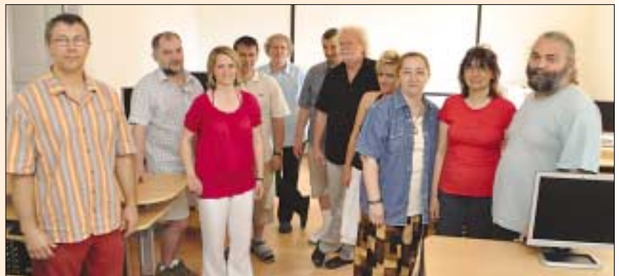
Fotónk június 23-án, az ECDL-programban résztvevő tanárok és a vizsgaközpont munkatársainak találkozásánál készült

Nem titkolt céljuk továbbá, hogy az itt vizsgázó tanulókat szüleit kedvezményes tanfolyamokkal csábítsák az intézménybe, hogy otthon közös nyelvet beszélhessen szülő és gyermek. (A programról bővebb információ a www.kszkioktat.hu oldalon található.) Sz. Cs.