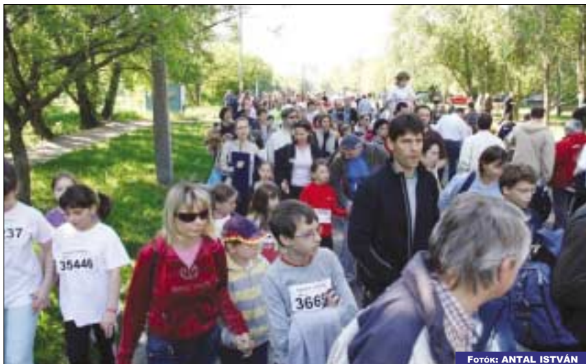
A verseny kezdete előtt a futók végigsétáltak a pályán

húzás zárta, sportszereket és LEGO ajándékokat soroltak ki a futók között. A megmérettetés útvonalát a III. kerületi kapitányság rendőrei biztosították. A verseny sikeres lebonyolításában az iskola vezetése és tanári kara is aktívan részt vett.