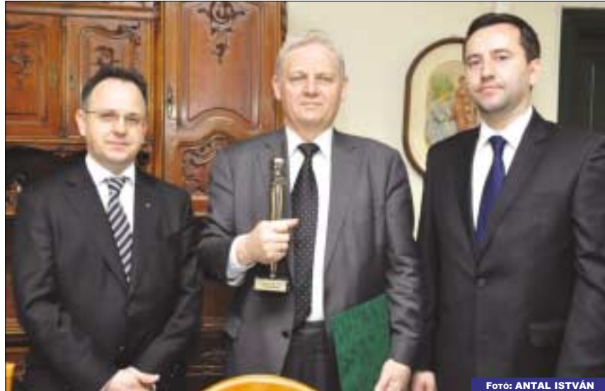
Bús Balázs, Óbuda-Békásmegyer polgármestere, Tarlós István, Budapest főpolgármestere és Pawel Bujski, Varsó Bemowo kerületének alpolgármestere a díjátadáson

A díjat minden évben lehetőleg Bem József születésnapján, március 14-én adják át, egyik évben Óbu-