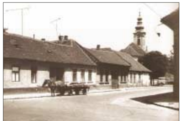
Szódásló Óbudán

A kiállítás nyitva tartási ideje alatt ( március 25-től október 31-ig ) az óbudai vendéglátáshoz, gasztronómiához kapcsolódó múzeumi programokkal, családi nappal, bográcsos főzőversennyel, múzeumpedagógiai foglalkozással várják a látogatókat az Óbudai Múzeumba.