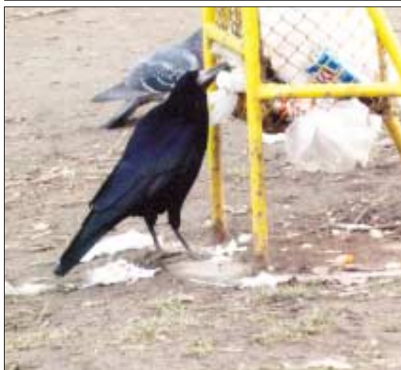
A madarak örülnek a nyitott szemeteseeknek. Egyszerűbb lakótelepeken guborálnak belőlük

Aki a tilalom ellenére avar, illetve kerti hulladékot éget, vagy a nyesedék elhelyezésére és elszállíttatására vonatkozó előírásokat megszegi, szabálysértést követ el, mely cselekményért 30.000 forintig terjedő pénzbírsággal sújtható.