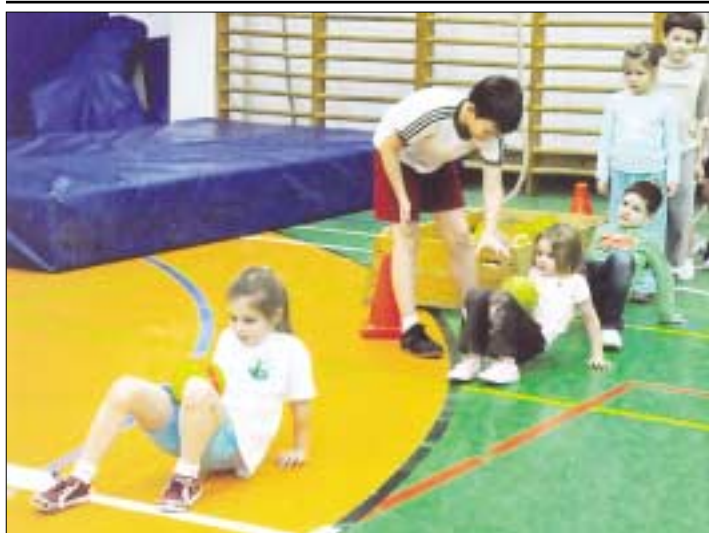
Nagycsoportos óvodásokat hívtak apróka tornapróbára január 25-én a Dr. Szent-Györgyi Albert Általános Iskolába, a „Varázsműhely” című foglalkozás-sorozatban

A III. kerületi pedagógusok a Pedagógiai Szolgáltató Intézet által szervezett Óbudai Pedagógiai Napokon, március 30-án 10 órától tekinthetik meg a „Mátyás kovács” című mesejátékot, illetve „A bika háza” litván népmese angol nyelvű színpadi adaptációját.