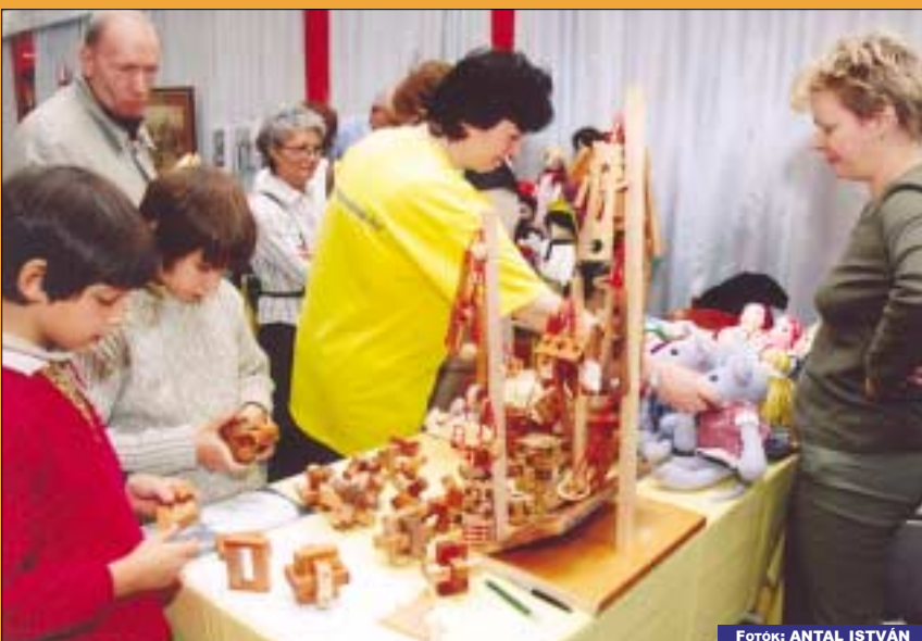
A gyerekek szüleikkel együtt számos fejlesztő játékot kipróbálhattak