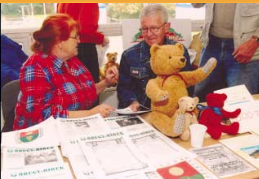
Az Óbuda Hegyvidékiek Egyesületének képviselői a Táborhegyi Népház programjait ismertették, bemutatták az „Őhegy-Hírek” című lapot