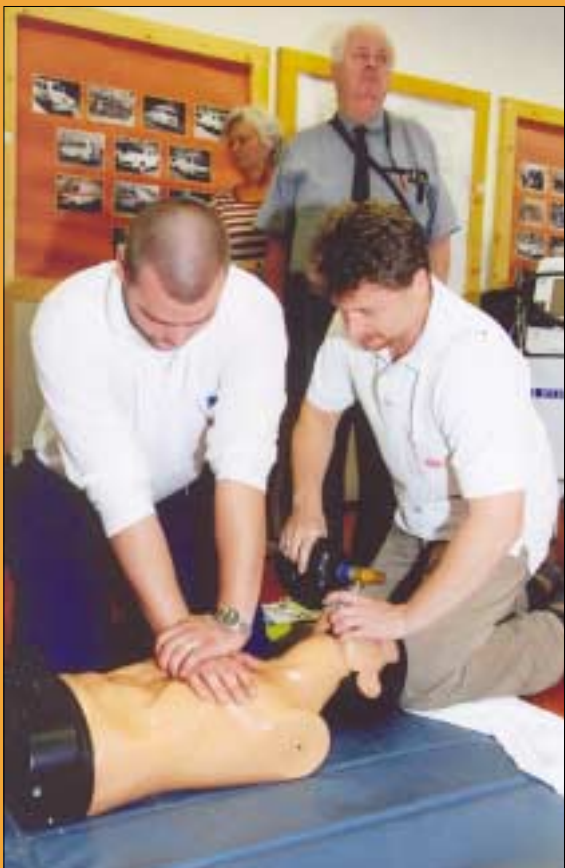
Mentőorvosok az elsősegélynyújtási ismereteket frissítették fel