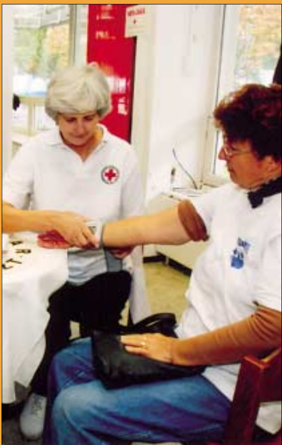
Ingyenes vércukor- és vérnyomásmérést végeztek a Magyar Vöröskereszt Budapesti Szervezetének munkatársai a vizsgálatokra jelentkezőknek