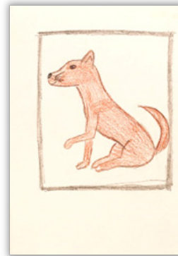
10–11. ábra: Éneklő madár, Hűséges kutya

A 11. ábra választott szimbóluma egy kutya, rajzolója egy 13 éves lány. A rajzhoz fűzött verbális közlés megerősíti a kutya sztereotip tulajdonságaival való azonosulást: Azért kutyát választottam, mert az hűséges. Akivel tényleg igazi barátságban leszek, azt nem hagyom ott. Van is két ilyen barátom nekem.