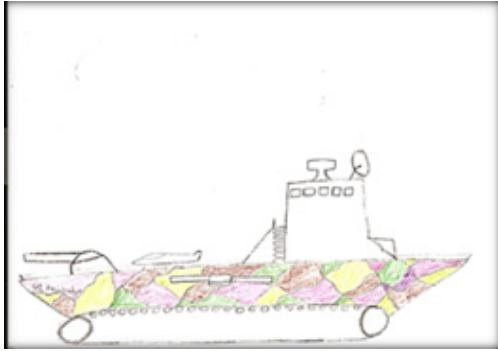
2. ábra: Lánctalpas hajó

A 3. ábrán lévő képet egy 14 éves fiú készítette. Két hajó is látható rajta. Az egyik egy háromkéményes óceánjáró, amelyik félig a víz alatt van, csak a kéményei lógnak ki a víz vonala fölé. A másik egy kicsi mentőcsónak, amiben egy pálcikaember áll és kiabál. (a szóbuborékban olvasható felirat: WohhoooOOOoo!) A kis csónak mellett egy kitátott szájú, nagyméretű hal látható hegyes fogakkal. A rajz formai és tartalmi jegyei, mind pedig a rajzoló önértelmezése bizonytalanságról, veszélyeztetett érzésről, erős szorongásról árulkodnak. A rajzoló így mutatja be a képet: Én nem a süllyedő hajón vagyok, hanem a mentőcsónakban! Azt meg bekapja egy cápa. Segítségért kiabálok.