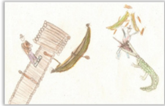
4. ábra: Kikötő krokodilokkal

így mutatja be a munkáját: A kikötő tele van krokodilokkal. Amikor el akartam indulni a hajómmal, akkor az egyik megtámadott. A hajót kettéharapta, engem felfal. A partról nézi egy ember, de nem segít.