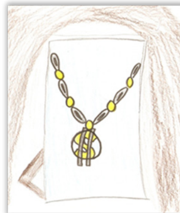
12. ábra: Dollár nyaklánc

ségnek és férfiasságnak, lehet spirituális jellege vagy összekötő, barátságot kifejező jelentése is. Érdekes példája ennek a 12. ábrán látható dollárjellel díszített nyaklánc a képe. A 16 éves cigány fiú választott szimbólumának rajza ez a medál, mely a nyakában lógott. A saját spórolt pénzéből vette. Ezt mondta róla: Nagyon tetszik nekem. Arannyal futtatott!