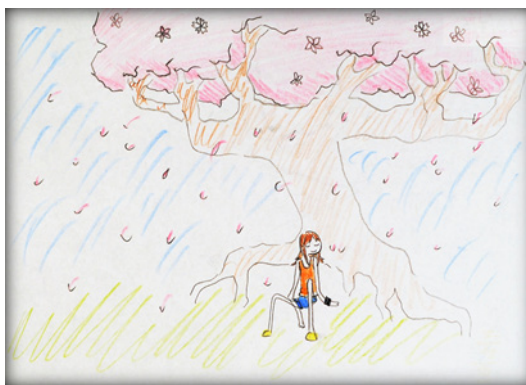
13–14. ábra: Rügyező fa, Cseresznyefa