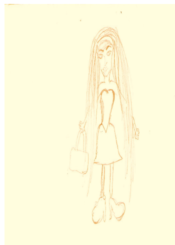
9. ábra: Barbie baba

2005; Bak in Kapitány és Kapitány , 1995, 361–371. o.). Jellegzetes motívum például a megszemélyesítés, ezen belül a választott szimbólum lehet antropomorf vagy zoomorf ábrázolás. Antropomorf szimbólumok olyan példaképek vagy vágyott alakok rajzai, mint például a világ leghíresebb focistája, kedvelt film vagy tévésorozat főszereplője, egy szép nő vagy kigyúrt férfialak. Antropomorf ábrázolásra mutat példát a 9. ábra, mely egy 15 éves cigány lány választott szimbólumának rajza. Így mutatja be: Ez egy Barbie. Én is az leszek nagy koromba, és lesz egy gazdag férjem.