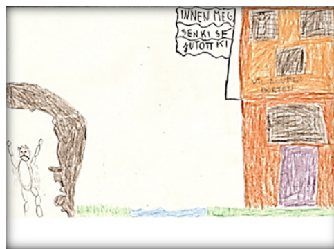
5–6. ábra: Ház a dzsungelben, Világvégi börtön

A 6. ábra egy 14 éves roma fiú rajza. A kép és a felirat is azt tükrözi, hogy a rajzoló a hajótörés, vagyis baj esetén milyen védelemre, milyen menedékre számít. Az épületen látható felirat szerint ez a ház a szigeten egy „világvégi börtön”. Bejárata mellett zászló leng, melyen a következő szöveg olvasható: „Innen még senki se jutott ki” . A bal oldali feltartott karú emberalak a rajzoló szavai alapján ő maga. Egy barlangban áll és elmondása szerint sír. Mivel a fiú tágabb családjában és ismeretségi körében többen ültek már börtönben, így feltételezhető, hogy a rajzban a saját jövőképe is megjelenik.