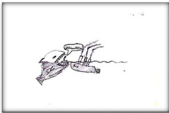
3. ábra: Süllyedő hajó

A 3. ábrán lévő képet egy 14 éves fiú készítette. Két hajó is látható rajta. Az egyik egy háromkéményes óceánjáró, amelyik félig a víz alatt van, csak a kéményei lógnak ki a víz vonala fölé. A másik egy kicsi mentőcsónak, amiben egy pálcikaember áll és kiabál. (a szóbuborékban olvasható felirat: WohhoooOOOoo!) A kis csónak mellett egy kitátott szájú, nagyméretű hal látható hegyes fogakkal. A rajz formai és tartalmi jegyei, mind pedig a rajzoló önértelmezése bizonytalanságról, veszélyeztetett érzésről, erős szorongásról árulkodnak. A rajzoló így mutatja be a képet: Én nem a süllyedő hajón vagyok, hanem a mentőcsónakban! Azt meg bekapja egy cápa. Segítségért kiabálok.