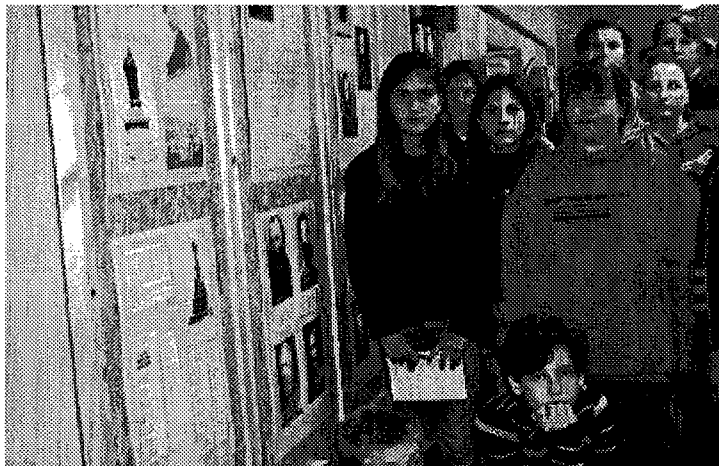
Az aradi vértanúkra emlékező kiállítást minden algyői iskolás megtekintette.