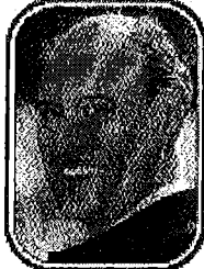
DR. KUPA MIHÁLY A Centrum Párt elnöke