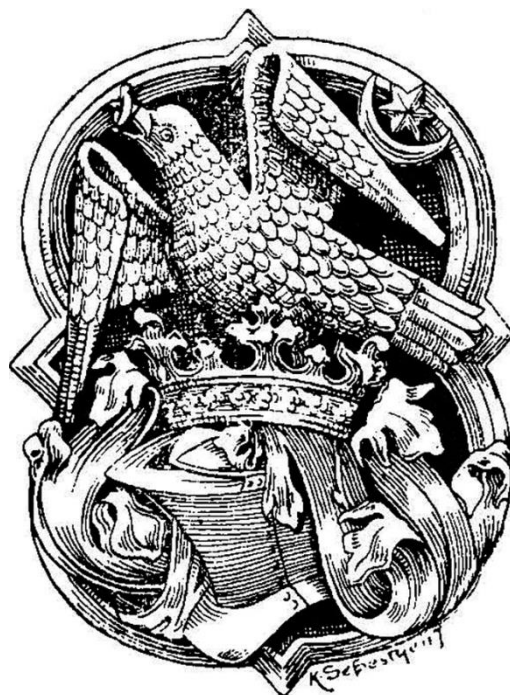
A vajdahunyadi vár kápolnájának boltzáró köve.

A magyar Hunyadi-uralkodóház székely eredetét a polihisztor Zágoni Aranka György az 1811-ben megjelentetett művének címlapjára tette.