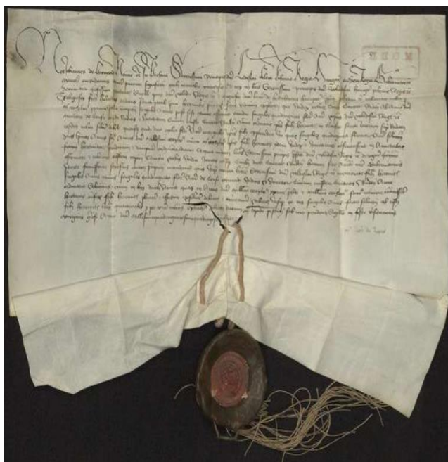
Hunyadi János 1446-ban kiadott oklevele.