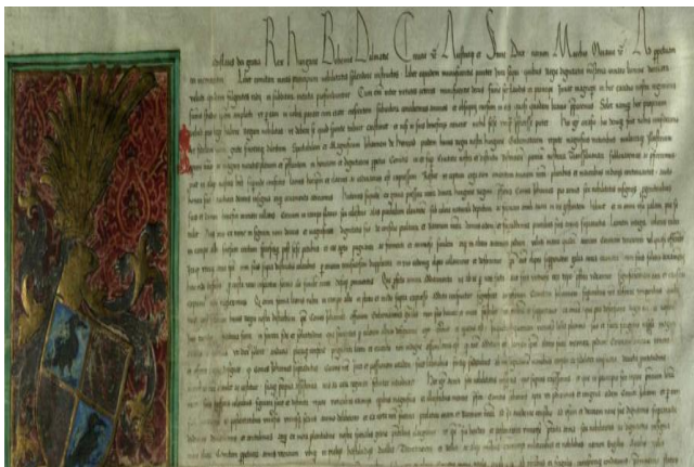
Hunyadi János címer bővítésének oklevele. (Forrás: DL 24762. Kelt: 1453. február 1.)