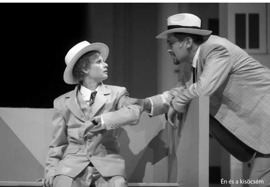
Én és a kisöcsém

Politikai döntés volt Kiss Csaba kinevezése a Miskolci Nemzeti Színház élére, ahogy minden színház igazgatója politikai kinevezett, csak hát van olyan eset, hogy a szakmai szempontok alapján is „jogos” a kinevezés, és van olyan, hogy nem. E logika mentén nem csoda, hogy a Miskolci Nemzeti Színház élén történt változás nem okozott országos szinten botrányt, hiszen a Halasi Imre irányította intézmény szakmai-kulturális szempontból afféle múzeum volt, hagyományos, konzervatív színházcsinálás, népszórakoztató profillal. Az intézmény — amely az ország leglátogatottabb vidéki kőszínháza volt az elmúlt években — tökéletesen izgalommentes működését jól jelzi, hogy utóbbi éveiben a szak-, illetve az országos kulturális sajtó minimális mértékben foglal-