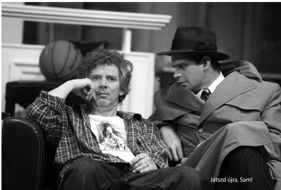
Játszd újra, Sam!