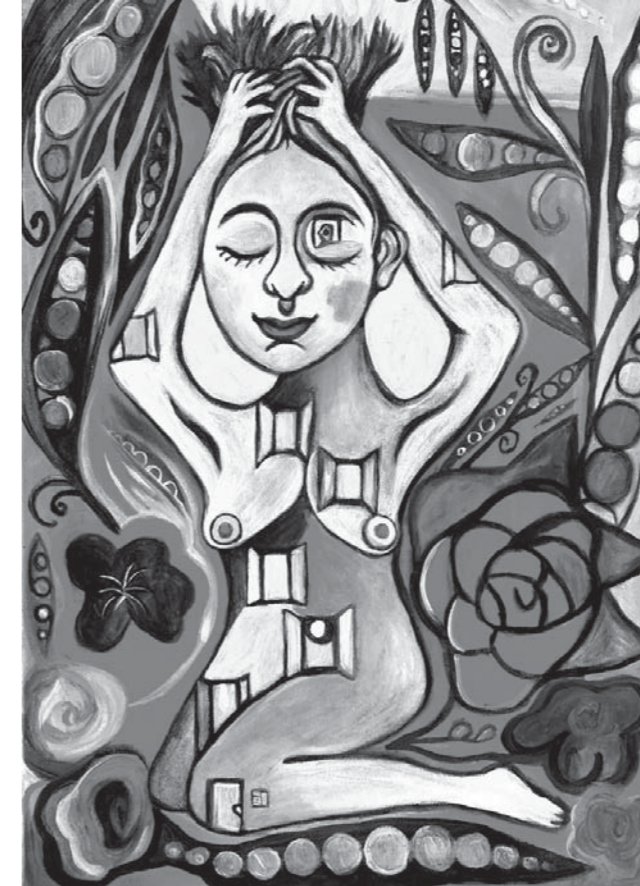
Rutkai Bori Borsós-rózsás Betonka, 2010

MEGSZÓLÍT AZ ÁRNYÉKOD , sürgősen vérre van szüksége, azt mondja, szökjetek meg, különben mindennek vége. Elnyel, mint a sír, vagy egy puha paplan, macskák legelnek a megürült istállókban.