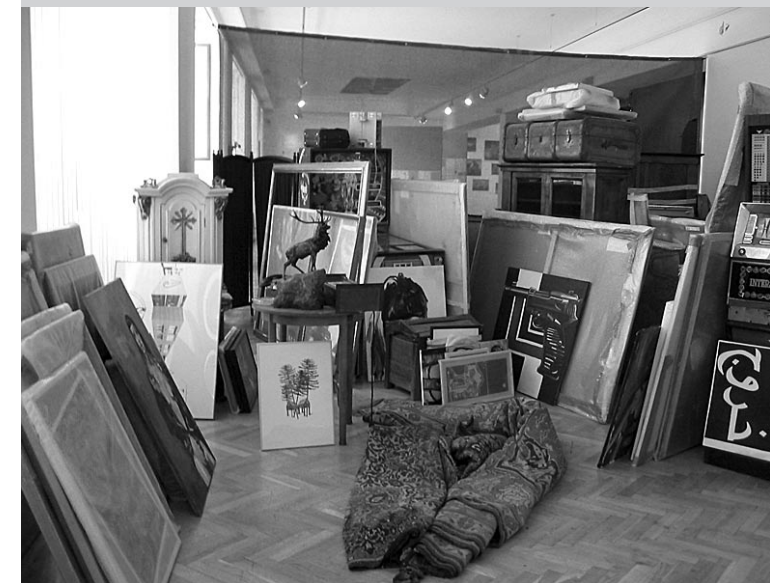
Illusztráció László Zsuzsa cikkéhez az Ernst Múzeumban rendezett Lenmechanika kiállításról. A képen Uglár Csaba munkája.

Az eredeti működési elvek tekintetében a legfontosabb aspektus a vizuális kultúra megnevezés: a blog a képzőművészet fogalmát az elmúlt évtizedek művészeti és teoretikus gyakorlatának fényében a társadalmi kontextustól nem függetlenül, hanem ebbe beágyazva, ennek függvényében tárgyalja. Egy kiterjesztett művészetfogalom jegyében a klasszikus műfaji és tematikus hierarchia helyett egyaránt terepet biztosít fősodorbéli művészeti