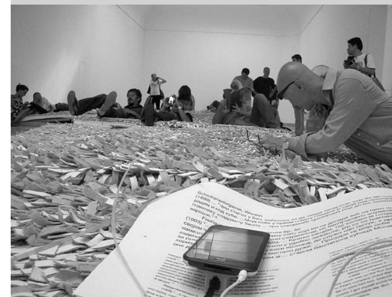
Illusztráció Somlyódy Nóra a Velencei Építészeti Biennáléről írott cikkéhez. A képen a szerb pavilon.