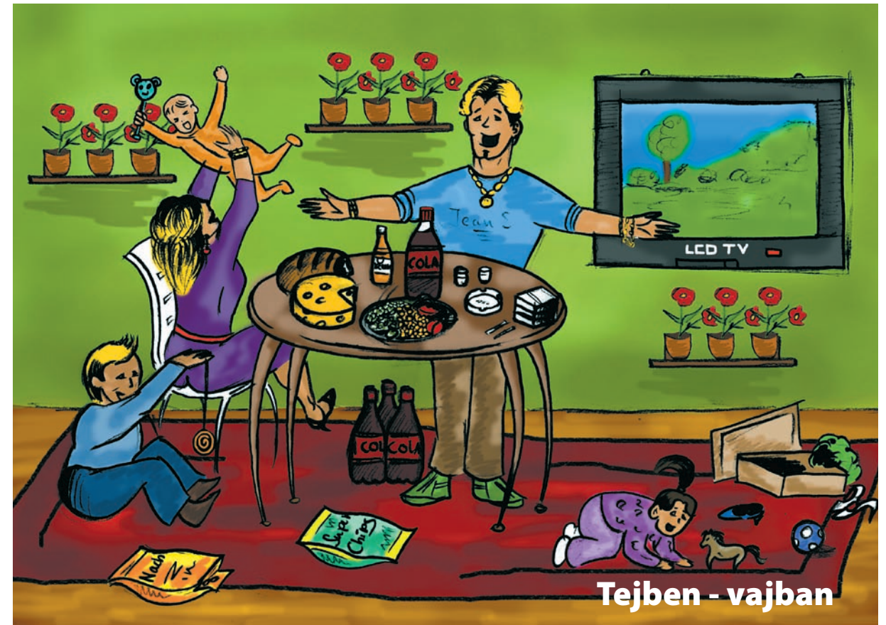
Tejben - vajban