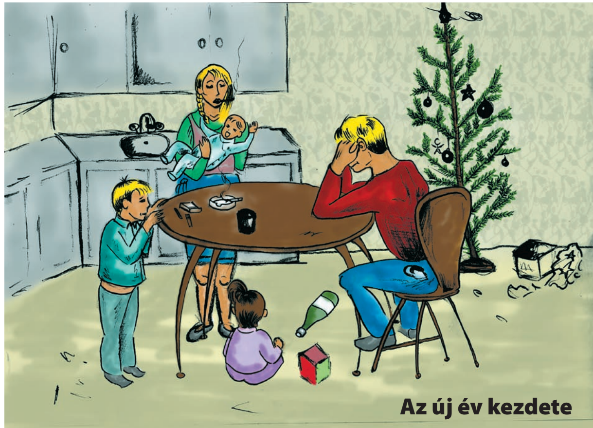
Az új év kezdete