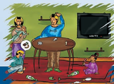
"A kölcsön elfogyott"