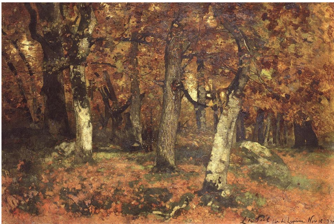
Paál László (1846-1879) festménye

Tisztelettel: A Polikróm folyóirat szerkesztősége