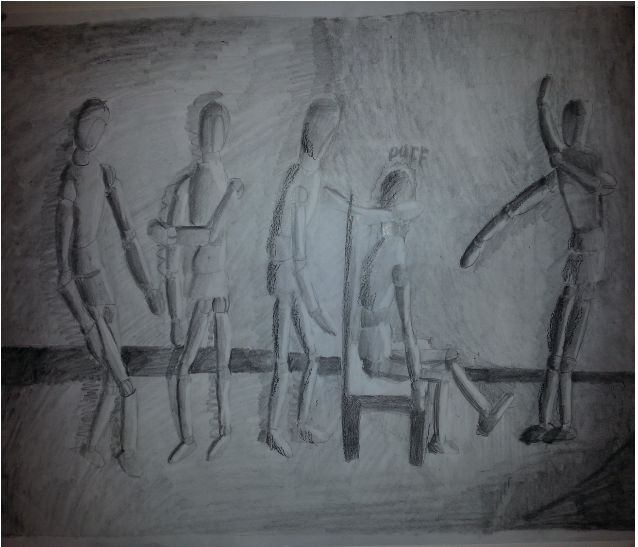
Sipos Péter: Bábuk