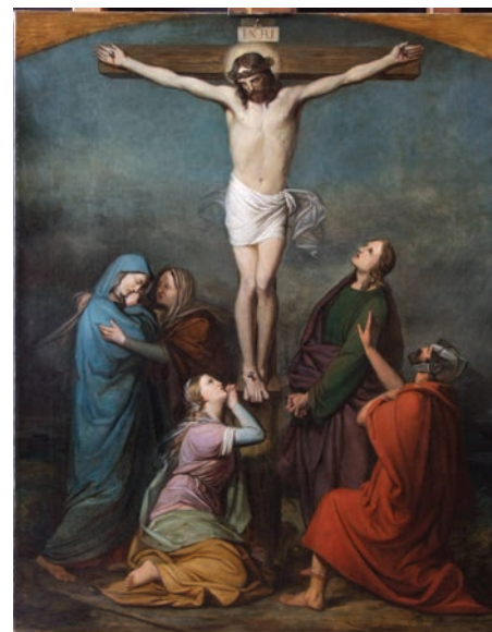
9. kép. Sárvár