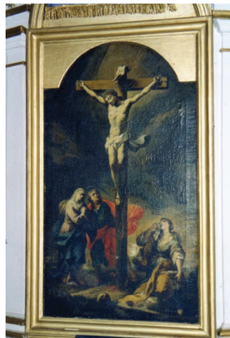
4. kép. Győrszemere