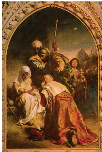
15. kép. Budapest-Fásor