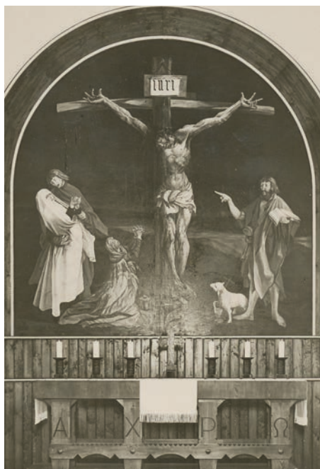
11. kép. Rákoskeresztúr