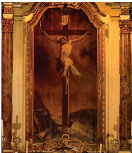
2. kép. Nyíregyháza