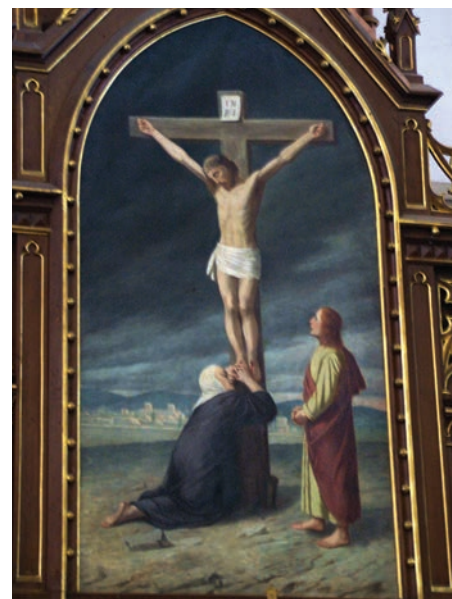
8. kép. Szarvas-Újtemplom

Marcalgergelyi első fatemploma 1754-ben leégett. Második fatemplomát is többször kellett felújítani. 1783-ban épült fel magtárra hasonlító, torony nélküli harmadik templomuk. A ma is álló, sorban negyedik, eklektikus stílusú templom 1910-re készült el. Az oltárképet ekkor Munkácsy Mihály Gol-