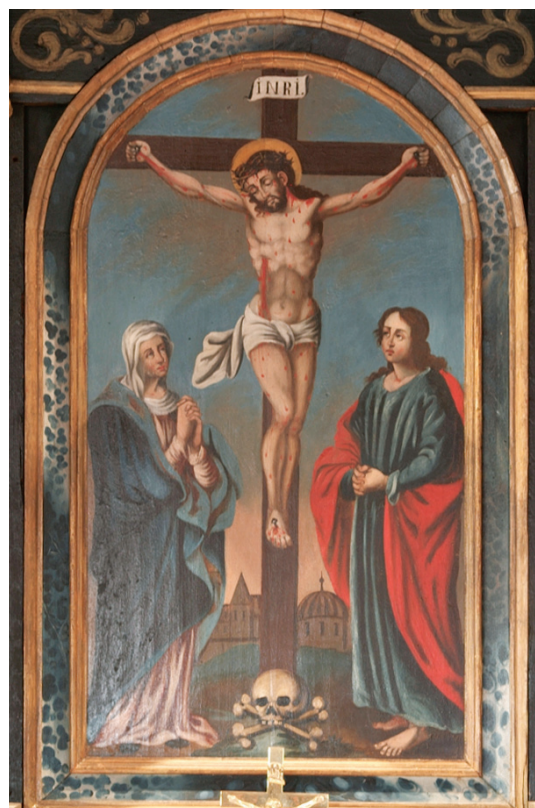
1. kép. Nemescsó

Egyházművészetünkből és azon belül festészetünkből szinte teljesen hiányzik a reformáció korának képvtitája, illetve az azokra adott egyedi válaszok. Csak példaként említem, hogy az írott bibliai szöveg és a képi ábrázolás összefüggéseiről szóló, Nyugat-Európában a reformációt követően kibontakozó vitára (BELTING 2000, 495. o.) a hazai válaszok jelentős időeltolódással születtek. Magyarországon száz vagy még inkább kétszáz évvel később érhetők tetten azok a megnyilvánulások, azok a képekkel kapcsolatos felvetések, amelyek ekkorra Európa nyugati felében már nyugvópontonra kerültek. Anélkül, hogy a jelenlegi témánktól eltérő problémát alaposabban elemezném, csak megemlítem, hogy Európában nálunk