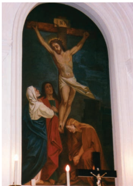
7. kép. Paks

míg a piros vagy vörös itt a szeretetet és a vért is jelenti (SEIBERT 1986). A kereszt tövében koponya, amely a keresztény ikonográfia szerint Ádám koponyája, az első emberé, akit Krisztus kiömlő vére a kereszten megváltott.