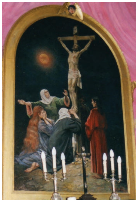
10. kép. Kéttbodony