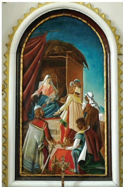
14. kép. Bakonymegyer