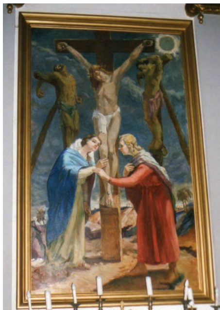
13. kép. Balf