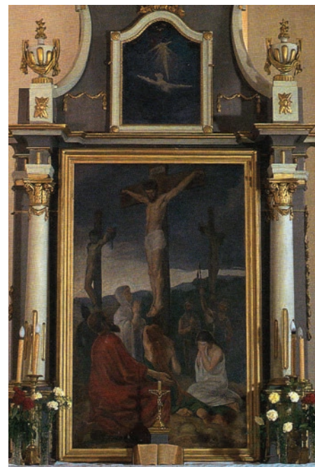
12. kép. Bánk

VELLADICS Márta 2000. Szerzetesrendi abolíció Magyarországon (1782–1790). Levéltári Közlemények , 71. évf. 1–2. sz. 33–52. o.