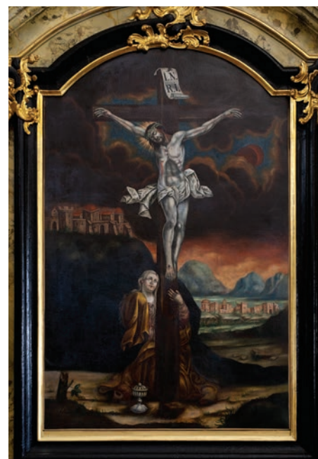
5. kép. Sárszentlőrinc