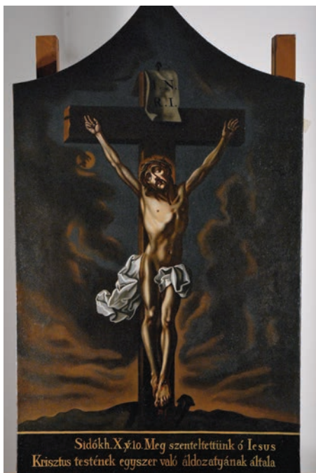
3. kép. Szakony

maradt fent a leghosszabb ideig az a gyakorlat, amely szerint az oltárképekre (az utolsó vacsora vagy a keresztre feszítés jelenete) festett formában is felkerültek az írott bibliai idézetek.