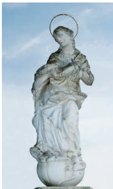
29. kép. Mihályi, 1780