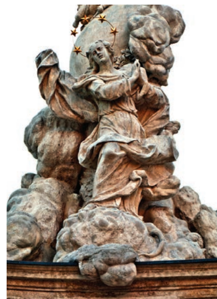
5. kép. Mária Immaculata a soproni Szentháromság-oszlopról