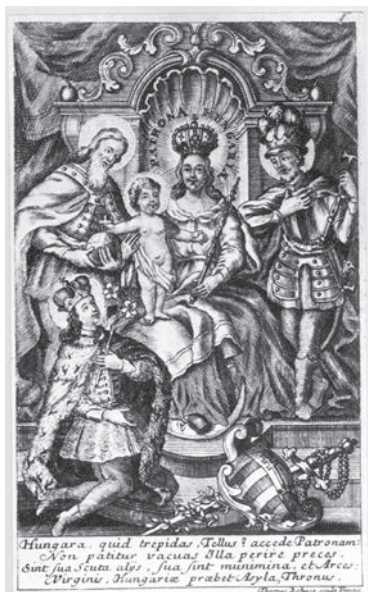
22. kép. Thomas Bohacz: Magyarok Nagymasszonya St. István, Imre és László körében, rézmetszet, 1740