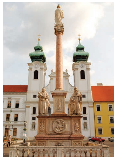
12. kép. Győr, Mária-oszlop a bencés templommal

A napba öltözött asszonynak a középkortól nagy kultusza van. A Jelenések könyvében olvashatunk róla, aki megjelenik „napba öltözve, és a lába alatt a hold, a fején pedig tizenkét csillagból álló korona; várandós volt” (Jel 12,1–2). Miután