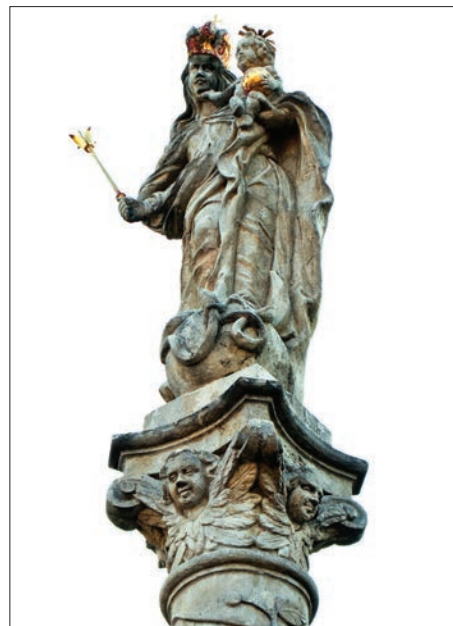
16. kép. Lövő, 1711

Az alábbiakban megkísérlem csoportosítani – ikonográfiai szempontok alapján – az emlékanyag egy részét. Céлом elsősorban az, hogy meglássunk valamit a Mária-oszlopok sokféleségéből. A Mária-oszlopok tetején – elsősorban a korábbi emlékanyagban – a (győztes) Madonna (tehát Mária a gyermek Jézussal) szobra áll. Többnyire koronával, a kisdud kezében hosszú szárú kereszttel mint a győzelem fegyverével. Lába alatt a sárkány gyakorta megtalálható. Más oszlopokon