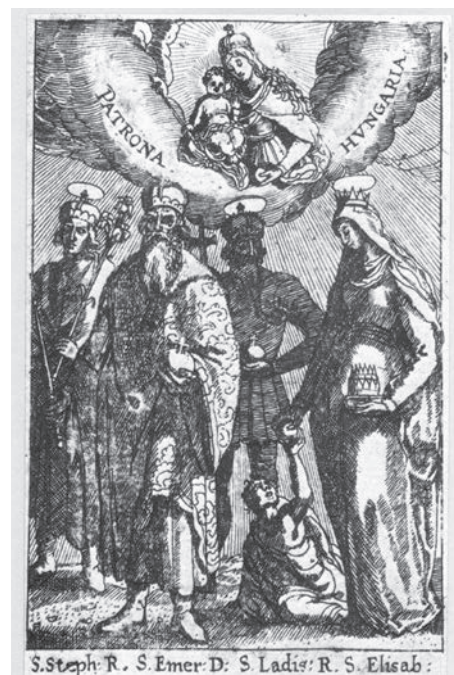
21. kép. Ismeretlen művész: Patrona Hungariae négy Árpád-házi szenttel, rézmetszet, 1600 k.