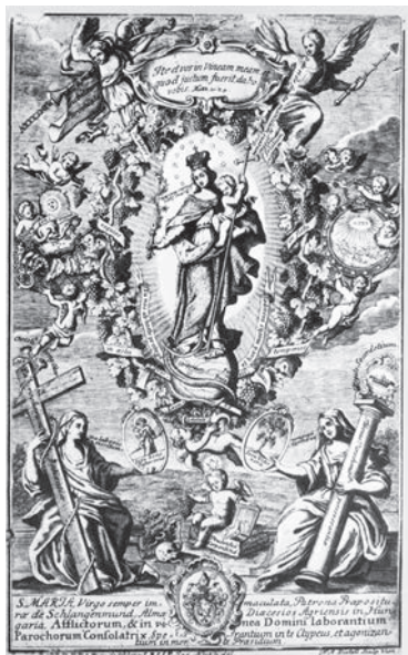
14. kép. F. A. Dietel: Győztes Immaculata allegorikus alakokkal, 1735