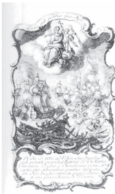
2. lép. J. S. Klauber és J. B. Klauber: A győzelemes Maria Immaculata a lepantói útközet fölött. Rézkarc, 1750 k.