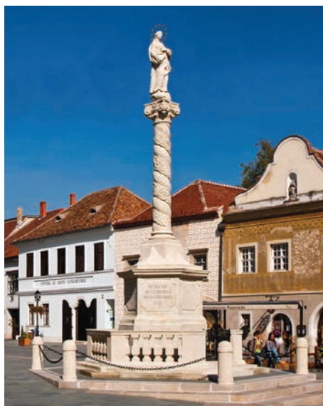
34. kép. Kőszeg, 1739