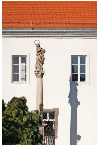
32. kép. Gyöngyös, 18. sz. közepe