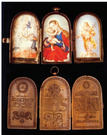
23. kép. Ismeretlen festő: Triptychon-medál, Maria Immaculata két szenttel, Segítő Mária és Szent József, 1696

pestis-émlékeken. A segítő szentek megjelennek kisnyomtatványokon, pestis ellen viselt medálokon és a köztéri szobrokon egyaránt. (23. kép)