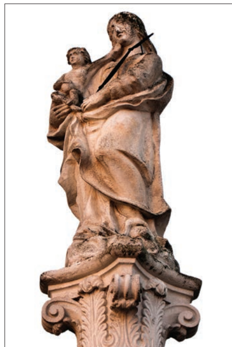
17. kép. Pereszteg, 1810