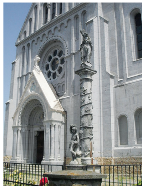
20. kép. Rábacsanak, Mária-oszlop szőlőindákkal és szent Sebestyénnel, 1714

A török háborúk idején, természeti csapások kapcsán, de leginkább az újra meg újra pusztító pestisjárványok miatt erősen megnövekszik a segítő szentek népszerűsége. Mária alakjának Szent Sebestyén, Rókus, Rozália a kísérői elsősorban a