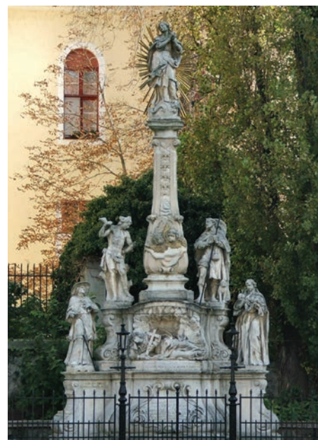
24. kép. Esztergom, 1740

Több néprajzi adatközlésben olvasni, hogy a Mária-szobor előtt elhaladók egy fohászt mondanak, Mária segítségét kérik valami baj elhárításában. Mindemel-