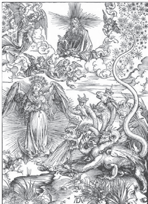
10. kép. Dürer: A Napbaöltözött asszony. Lap az Apokalipszisből. Farnetszet, 1497–98

a női, asszonyi értékek megtestesítője, ugyanakkor előképe és ismerője minden asszonyi öröme, gyötremnek vagy szomorúságnak. (8. kép)