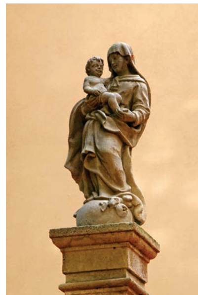
33. kép. Madonna. Fehértó, 1747