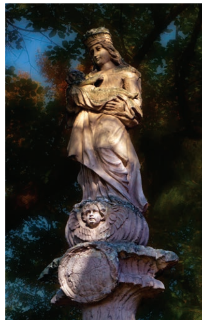
8. kép. Csepreg, pestis-oszlop. Maria lactans, 1740 k.

A II. vatikáni zsinat tanításában anyai szolgálatot teljesít, gondoskodása minden hívőre kiterjed, de nem konkurál az Atya gondviselésével. Hiszen az anyagi üdvözlésre adott válaszában vállalja alárendelt szerepét, szolgálóleánnyá lesz (GÁNÓCZY 2005). Minden befolyása Istentől származik, és közbenjárása azt is jelenti, hogy készsé teszi az embert a Magasságos befogadására. A magyar népi Mária-tisztelet keresi a vele való találkozást, egy bizonyos együttélést. A Szűzanyát saját paraszti környezetébe állítja, konkrét élethelyzetekben rá hivatkozik, utánozza. Mária életének és saját életének párhuzamait felerősíti. Ez odáig is mehet, hogy a gyerekágyat bizonyos vidékeken „Boldogasszony ágyának” is nevezik, s onnan mennek a fiatal édesanyák az egyházkelés szertartására, mint egykor Mária (HETÉNY 2001, 29–30. o.). Mária azért is lehetett, lehet annyira népszerű a hívek mindennapjaiban, mert a férfias Szentháromság mellett