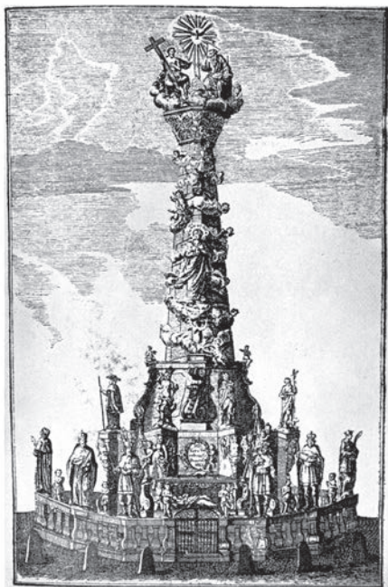
6. kép. A pesti Szentháromság-oszlop (elpusztult)