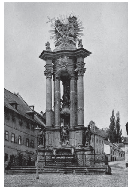
4. kép. Selmecebánya, 1755

Nem véletlen tehát, hogy az első nagy bécsi járvány után állítják fel az első „pestisoszlopot” – először fából, majd a legnagyobb mesterek (Fischer von Erlach,