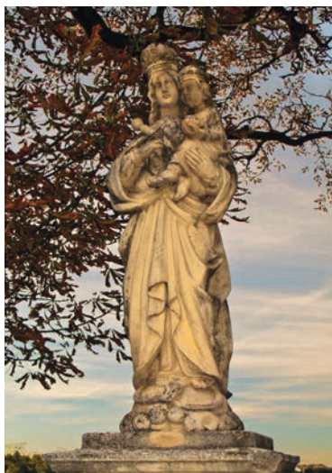
15. kép. Völcsej, 19. sz eleje

megszüli fiát, a sárkány el akarja tőle rabolni, de a gyermek elragadtatik Istenhez, a sárkányt pedig Mihály arkangyal legyőzi. Az idők végének jövendölése nagyon korán összekapcsolódott az idők kezdetén elhangzott jövendöléssel, amit a Teremtő a kísértőnek mond: „ Ellenségeskedést támasztok közted és a asszony közt, a te utódod és az ő utódja közt: ő a fejedet tapossa, te meg a sarkát mardosod. ” (1Móz 3,15) A napba öltözött asszony természetesen elsősorban a bűn, a sátán fölötti győzelem jele, ám nem nehéz azonosítani a sárkányt minden legyőzendő hitetlennel, eretnekekkel mint a sárkány ivadékaival. Az apokaliptikus – legyőzött – félholdban pedig nemcsak Mária hitének változatlanságát, 4 hanem a pogányság felett a hit diadalának, aktuálisan a török legyőzésének ígérését is látták: „e föltételezés szerint a Mária jelképezte kereszténység diadalt fog aratni.” 5 A napba öltözött asszony a középkorban az egyház ( ecclesia ) megtestesítője, később egyre gyakrabban istenanyaként értelmezték. A ferenceseknél a napba öltözött asszony egyenesen a szeplőtelen fogantatás szimbóluma volt.