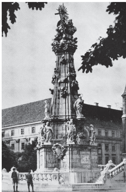
7. kép. Szentháromság-oszlop, Buda, 1712–13

Burnacini) készítik el kőből. A számos mellékalak között a pestist jelképező figurát a hit égő fáklyája teríti a földre (ZOLTÁN 1963, 27. o.).