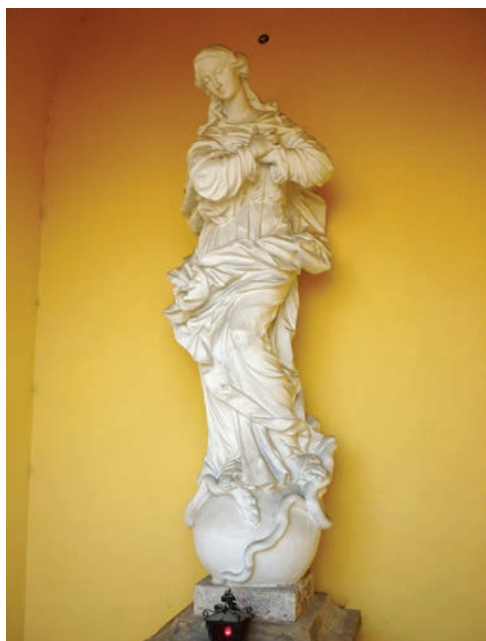
11. kép. Győr, ún. Hab Mária, 1735

A Mária-kegyhelyek rohamosan szaporodtak a korszakban. Az 1673-as Marianischer Atlas (München) ezerkétszáz kegyképe között a szerző összesen két magyar emléket említ, amelyek ráadásul épp a hódoltsági területekre estek. Esterházy Pál első műve ( Az egész világon levő csudálatos boldogságos Szűz kepeinek rövideden föl tet eredeti , 1690) is még csak tizenegy kegyhelyet tartalmaz, elsősorban a nyugati vidéken. A híres Mennyei koronában viszont