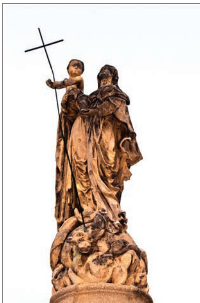
19. kép. Sopron, a Mária-kút szobra, 1780. k

a Maria Immaculata típust találjuk, amelyről már szoltunk. Mellékalakok mindketőjükhez kapcsolódhatnak.