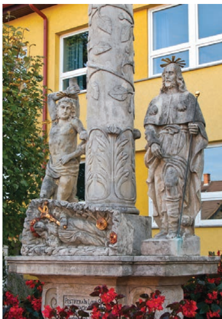
26. kép. Lővő, 1711. Az oszlop lábánál szent Sebestyén és Rókus áll, az előtérben Rozália fekszik érintetlenül, rózsákkal körülveve a sírban.