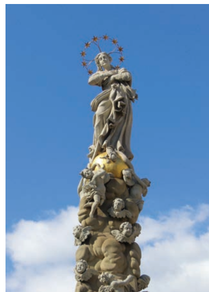
9. kép. Kassa, Maria Immaculata, Gríming Simon, 1720–22