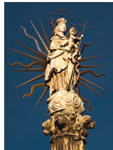
1. kép. Budapest, Mária tér

A 17–18. században megnőtt a laikus vallásgyakorlás igénye. A középkorban elszigetelten működő vallásos társaságok helyét olyan laikus társulatok vették át, amelyek gyakran egymással is kapcsolatban álltak, hálózatokat alkottak. Ezek között (a ferences kordások után) a különféle Mária-társulatok vitték a vezető szerepet. A legtöbb társulat a katolikus vagy gyorsan rekatolizált területeken alakult (Nyugat-Dunántúl, Északnyugat-Magyarország, Alföld katolikus többségű vidékei) (TÜSKÉS–KNAPP 2001, 273. o.). A társulatok gondozói szerzetesrendek voltak, elsősorban ferencesek és jezsuiták. A társulatok létrehozásának célja a közösségek erősítése, imaközösségek létrehozása, a gyülekezeti feladatok ellátására alkalmas személyek megtalálása. (Később sajnos a fegyelmező, ellenőrző funkció lépett előtérbe.) (TÜSKÉS–KNAPP 2001, 279–281. o.) Témánk szempontjából a Mária-kongregációk és a rózsafüzér-társulatok kiemelten fontosak. Céljuk Mária tiszteletének elmélyítése, ünnepeinek méltó megülvése, a szombati Mária-ájtatosságok kézben tartása.