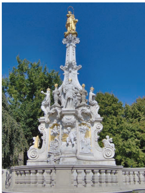
3. kép. Maria Immaculata , Nyitra