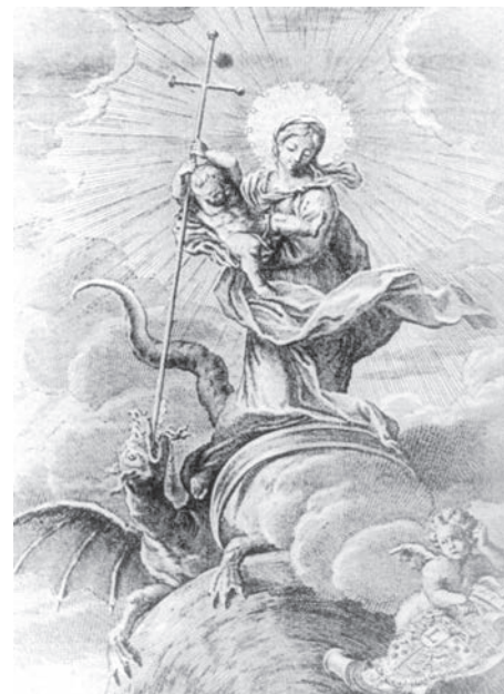
28. kép. Id. Johann Andreas Pfeffel: Győztes Immaculata Esterházy Pál nádor hercegi címerével, rézmetszet, 1688