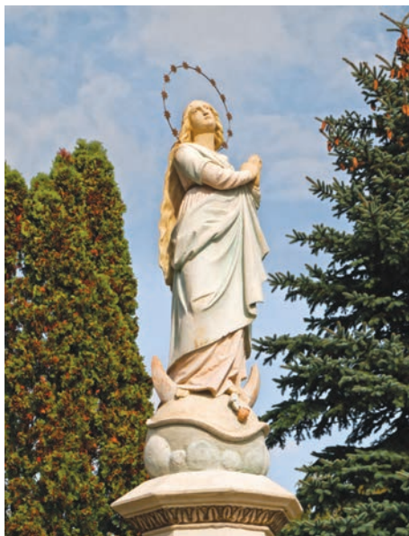
31. kép. Hegyfalu, 1820