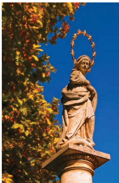
30. kép. Békásmegyer-Ófalu, 1770 k.