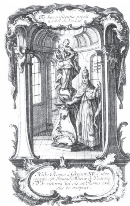
13. kép. Klauber: Győztes Immaculata római szobra XV. Gergely pápával, 1750. k.