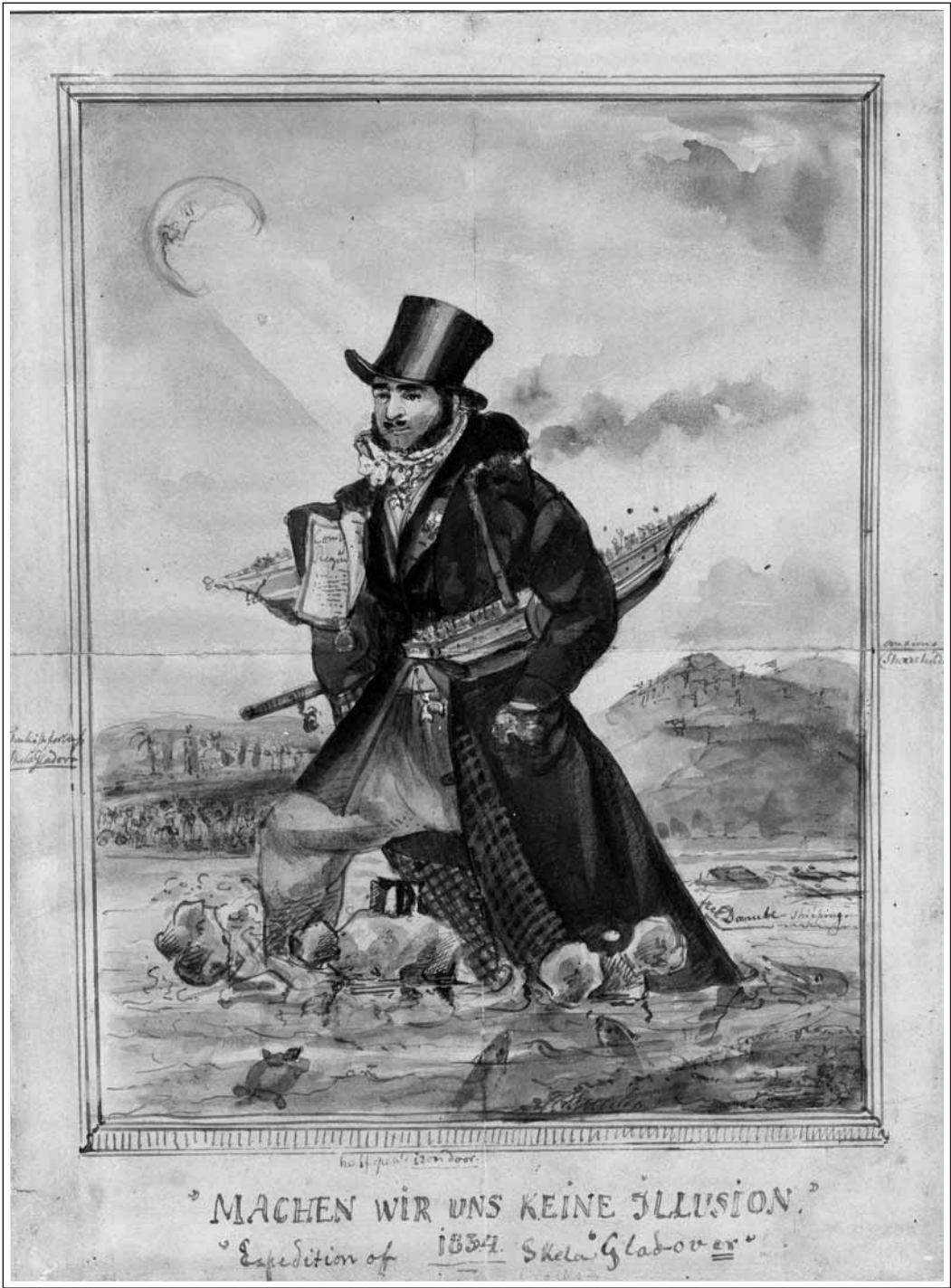
”MACHEN WIR UNS KEINE ILLUSION.” ”Expedition of 1854. Skela Glad-over”