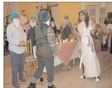
A Széchenyi István Német Nemzetiségi Tagóvoda nevelőtestülete

Reméljük, hogy 2009-ben is találkozunk a – már hagyományos – Márton napi rendezvényeken. Ősszel újra várjuk a kérdéseket, hogy lesz-e és mikor...?