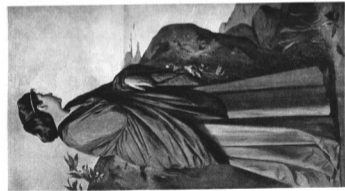
ANSELM FEUERBACH : A TENGER PARTJÁN. 1875