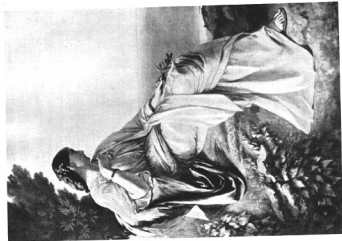
ANSELM FEUERBACH: IPHIGENIA. 1862 Darnstadti múzeum