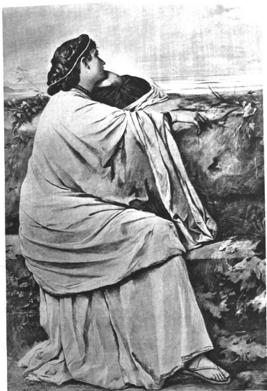
ANSELM FEUERBACH: IPHIGENIA. 1871 Stuttgarter museum