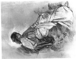
ANSELM FEUERBACH: TANULMÁNYRAIZ A DARNSTADTI MÚZEUMBAN ŐRZÖTT IPHIGENIÁHOZ (1862) Orsz. M. Szépművészeti Múzeum