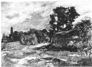
HERMAN LIPÓT: LELLEI TÁJ Budapesti székesfőváros telődése