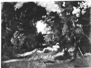
HERMAN LIPÓT: ERDŐ BELSEJE