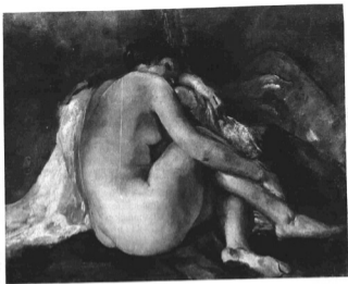
HERMAN LIPÓT: ALVÓ AKT Solti János ír tulajdonságra