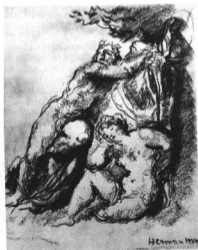
HERMAN LIPÓT: NIMFÁK. Raiz Az Orsz. M. Szépművészeti Múzeum tulajdonságra