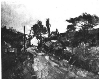
HERMAN LIPÓT: FALLSI ÚTCA