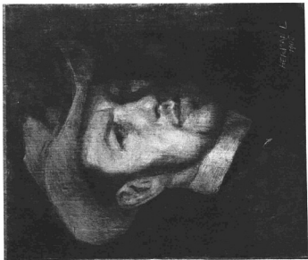
HERMAN LIPÓT: ÖNARCKÉP, 1905