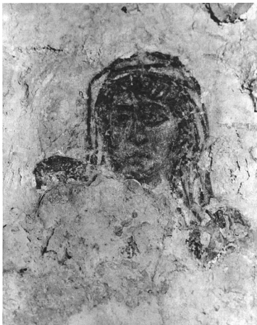
MADONNA FEJE, fallestmény, a pécsi őkeresztény sírkamrában, a IV. század közepéről