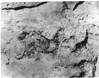
ÉVA FEJE AZ ÖSSZILÓK BŰNBESÉST ÁBRÁZOLÓ FALFESTMÉNYRŐL A PÉCSI ÓSKERESZTÉNY SÁRKAMRÁBAN Kr. u. IV. század közepeéről