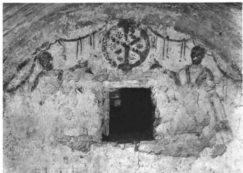
FALFESTMÉNYEK (Krisztus-monogramm, Péter és Pál apostolok és füzérek) A PÉCSI ŐSKERESZTÉNY SÍRKAMRA ÉSZAKI FALÁNAK SZELLŐZTETŐ NYILÁSA KÖRÜL. Kr. u. IV. század