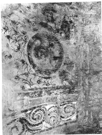
RÉSZLET A PÉCSI ÓSKERESZTÉNY SÁRKAMBA FALFESTÉSSEL DÍSZÍTETT BOLTOZATÁRÓL. Női szent a kerek medallionban. Virágcsokrok, éjszakai virágok a mennyei paradicsomként képzésére Páva, mint a halhatatlanság jelképe. Kr. u. IV. század középeiről