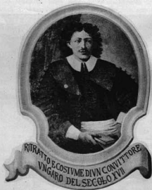
BOLOGNAI MAGYAR ILLIR-KOLLÉGIUM XVII. századi magyar kollégista