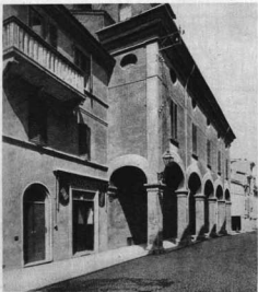
A BOLOGNAI MAGYAR ILLIR-KOLLÉGIUM HOMLOKZATA