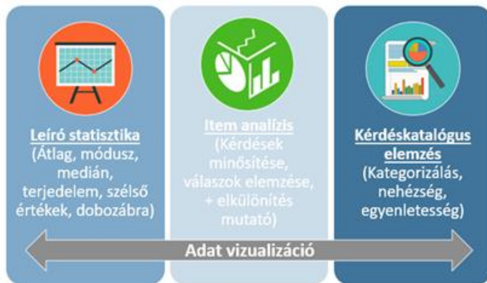
6. ábra: Összefoglaló

Az alábbi ábra foglalja össze az általunk elvégzett méréseket, elemzéseket: