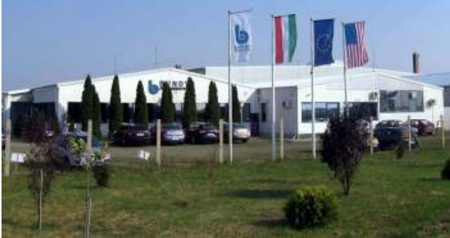
Bundy Kft. - Jászárokszállás

A cégcsoporton belül nemcsak a magyarországi gyár foglalkozik hűtéstechnikai alkatrészek gyártásával, hanem egyéb gyáregységek is. Magyarországon kívül a következő országokban van még Bundy-gyár: