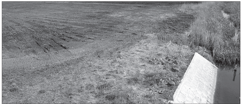
Egyelőre csak csordogál a víz a tározóba

közelítése, valamint a körbejárhatóságának lehető legnagyobb mértékű biztosítása érdekében az északi záródtöltésen 400 m hosszban aszfaltburkolat, a nyugati töltésen 1100 m hosszban kőszórással stabilizáció és keleti, dél-keleti oldalon 2860 m hosszban új szervízutak kerültek kialakításra.