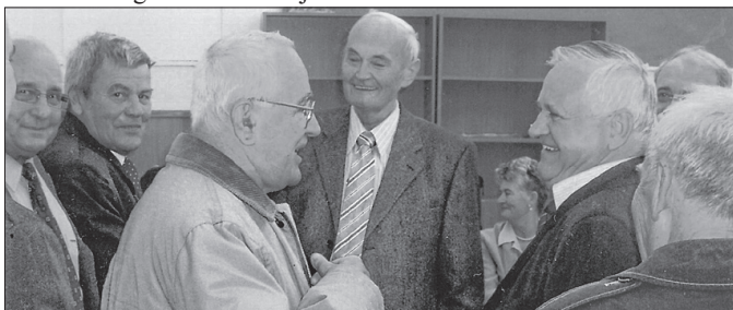
Az első találkozón találkoztunk, hogy ki kicsoda