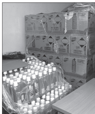
Tisztasági csomagokat is osztottak a EFOP pogramnak köszönhetően