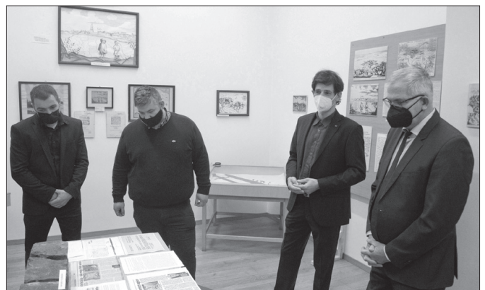
A tárlók relikviákat rejtenek a nagykállói várról