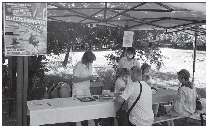
Az egészségnapokat is a projekt keretében szervezték meg Nagykállóban

Az Emberi Erőforrások Minisztériuma 493 709 157 forint vissza nem térítendő támogatásban részesítette a konzorciumi megállapodást kötött Nagykálló, Biri, Bököny, Geszteréd, Fábíánháza, Kisléta és Vállaj településeket az EFOP-1.5.3-16-2017-00041 azonosítójú „Humán szolgáltatások fejlesztése Nagykállóban és térségében” elnevezésű projekt keretében.