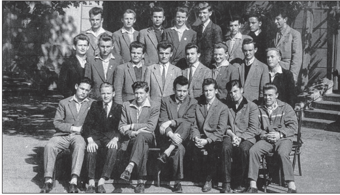
Az osztály egykor