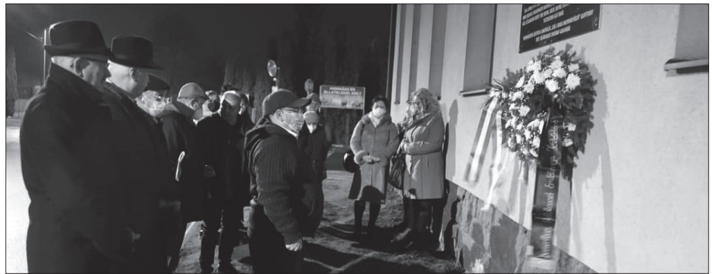
Főhajtás a nagykállói áldozatok emléke előtt

A „Szól a kakas Hagyományörző” Alapítvány megemlékezéssel egybekötött koszorúzást tartott a holokausztt áldozatainak nemzetközi emléknapja alkalmából Minden év január 27. napja a holokausztt áldozatainak