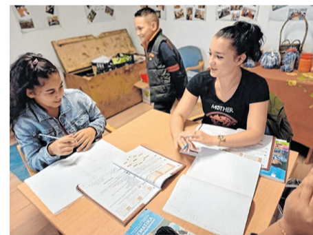
Tanulást támogató foglalkozások az Akácoss úton

*A meghirdetett akció 2020.09.14-2020.11.14-ig, illetve a készlet erejéig érvényes.