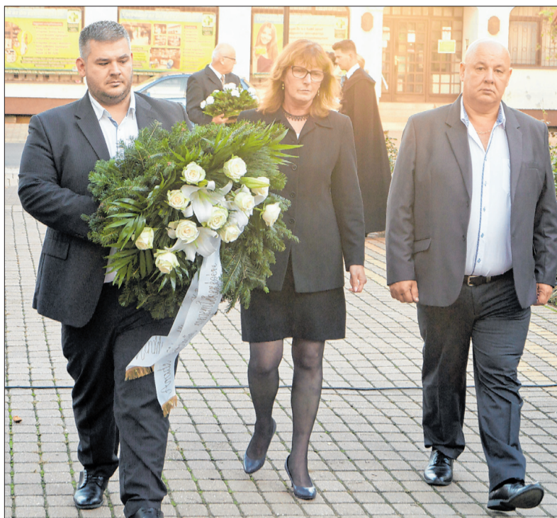
Fejet hajtottak a mártírok emléke előtt