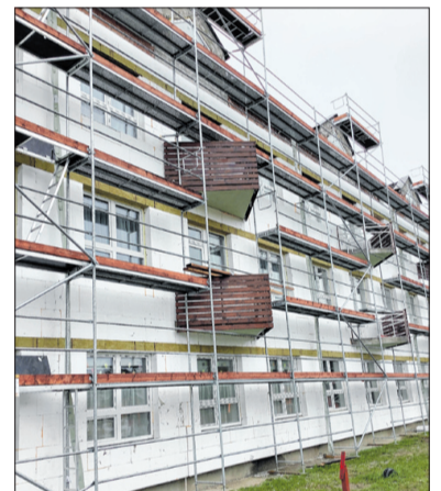
A kollégium épületét korszerűsítik

- Az elmúlt hetekben már megtörtént a nyílászárók (ablakok, ajtók) cseréje az épületen. Jelenleg a kollégium energetikai korszerűsítése zajlik, ami azt jelenti, hogy 18 cm-es külső hőszigetelést kap a keleti-nyugati leány és a déli fiú szárny. A radiátorok termo fejjel lesznek ellátva, ami automatikusan érzékeli majd a helyiség hőmérsékletét, és a beállított alapjelnek megfelelően a szelepet nyitja és zárja. Ezzel megszüntethetjük a helyiségek túlfűtését, beállíthatjuk az ideális hőmérsékleti értéket minden helyiségben. A nagyon rossz minőségű ebédlő tetőszerkezetét is