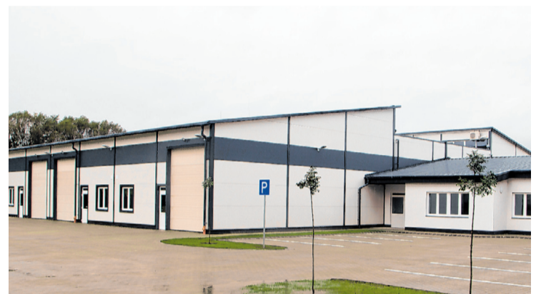
Hamarosan kezdődhet a termelés az épület egységeiben

Az elmúlt évben Európai Unió forrásból 661 484 000 forint vissza nem térítendő támogatást nyert az önkormányzat inkubátorház építésére, amelynek kivitelezési munkálatai idén tavasszal kezdődtek. A koronavírus-járvány ugyan hatással volt az építési munkákra, ennek ellenére sikerült határidőre megvalósítani az épületet, aminek köszönhetően október 5-én megtörtént a műszaki átadás, továbbá a kivitelező elvégezte a szükséges (garanciális) javításokat is.