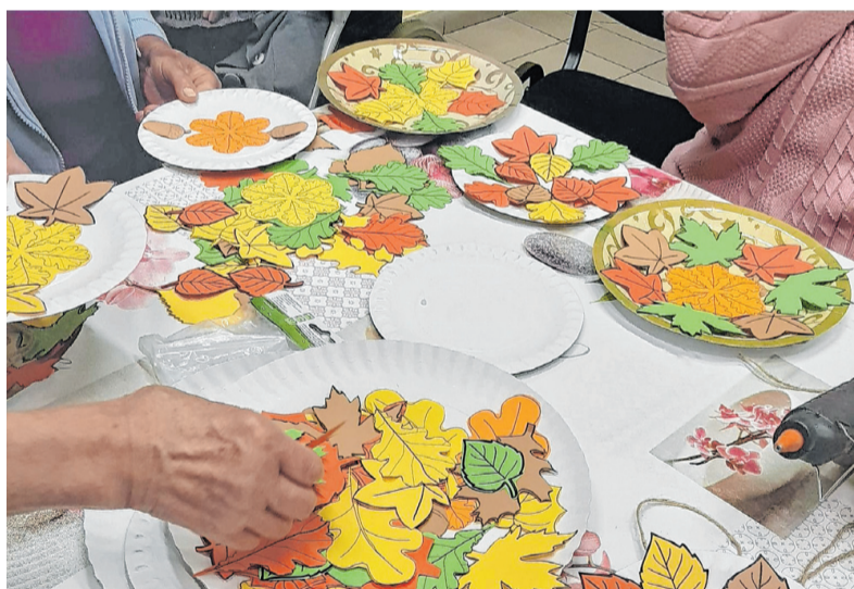
Az Idősek Otthona lakói őszi díszeket készítettek