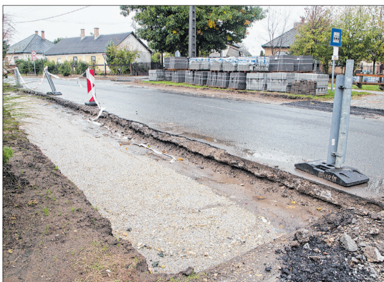
Várhatóan jövő hónap végéig tart a felújítás a Debreceni úton