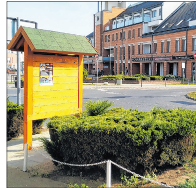
Új utcabútorok városszerte