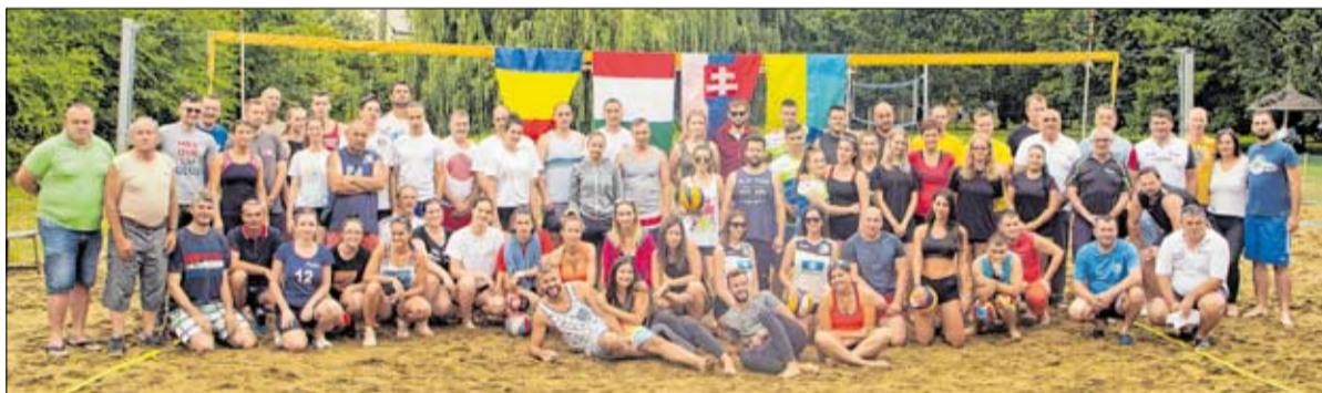
A kilencedik torna résztvevői