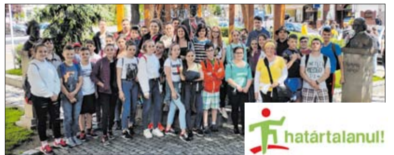
A Korányi diákok Erdély kincseit fedezték fel

A harmadik napon Zeteváralja „kinceseit” fedeztük fel. Gyalogtúra vezetett a Zetelakai víztározóhoz, majd látogatást tettünk a Jókai Mór Általános Iskolában. Átadtuk ajándékainkat, és közös programok keretében ismerkedtünk meg a helyi hagyományokkal és a diákélettel. Délután Székelyudvarhely nevezetességei vártak ránk.