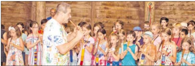
A Magonc tagjai a harangodi táncsűrben is remek koncertet adtak

Idén is felejthetetlen élményben lehetett részük azoknak, akik részt vettek a Magonc együttes koncertjén Nagykállóban. A református műemléktemplomban és a harangodi táncsűrben tartott hangversenyen az Óbudai és az Újpesti Waldorf Iskola növendékei furulyát, gitárt, kobzost és hegedűs szólaltattak meg,