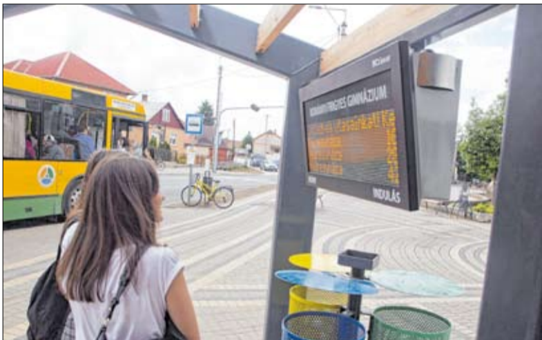
Az új megállóban valós idejű utastájékoztató tábla segíti a közlekedőket

A RUMOBIL projekt az Interreg Central Europe Programból, az Európai Regionális Fejlesztési Alap támogatásával, az Európai Unió és a Magyar Állam társfinanszírozásával valósult meg.