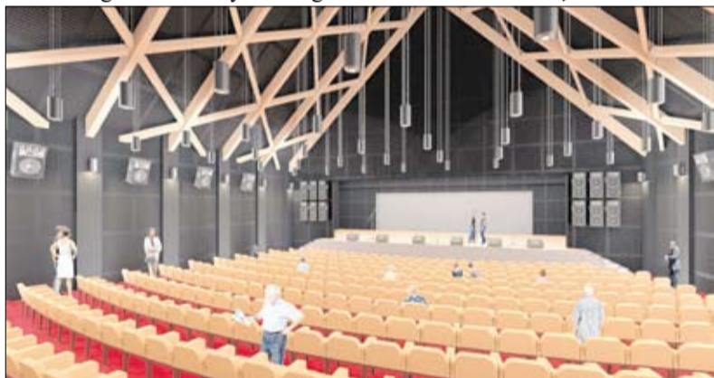
Látványterven az új színházterem