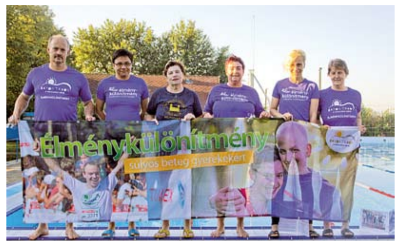
Az Élménykülönítmény tagjai