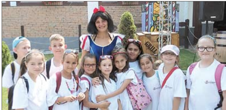
A táborozók egy csoportja

A sport, egészséges életmód, a környezettudatosság, a hagyományörzés, kézművesség, az önismeret, közösségépítés témájához kapcsolódó színes programok és napi négyzéri