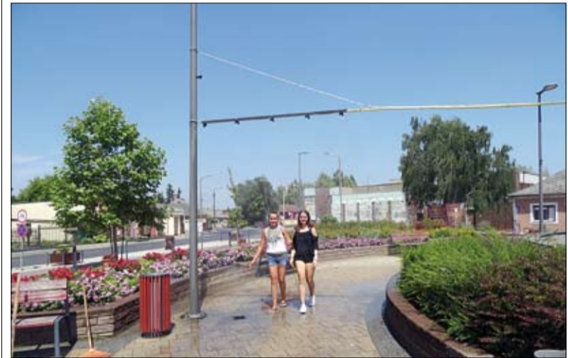
A rekordhőség idején jól jön a frissítő permet

A párapapok lényege, hogy a vízpermet, egészen finom vízcseppekből áll, a vízköd másodpercek alatt elpárolog, így csak a folyamat „mellékhatása”, a levegő drasztikus lehülése érzékelhető, így lényegesen hatásosabban csökkentik a hőérzetet.