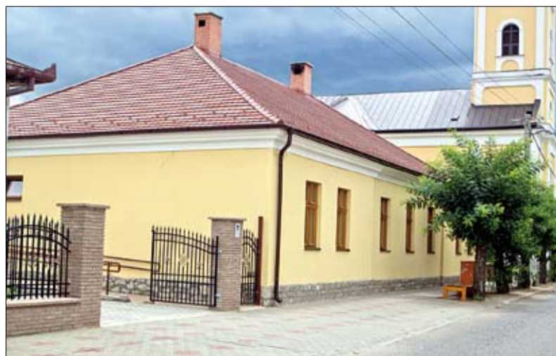
Kívül-belül megújult az épület