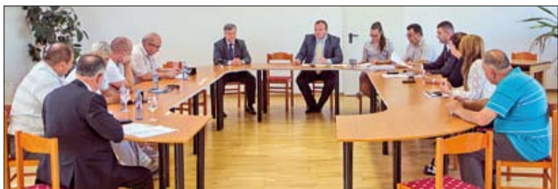
Együttműködési megállapodást kötöttek

A projekt az Európai Unió támogatásával, az Európai Szociális Alapból és hazai központi költségvetési előirányzatból, vissza nem térítendő támogatás formájában kerül finanszírozásra.