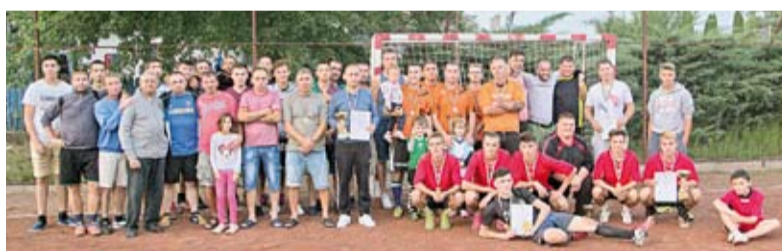
A torna résztvevői