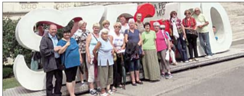
A Tisza-parton, a Móra Ferenc Múzeum lépcsői előtt