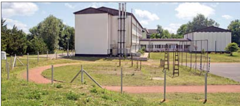
Szeptembertől már itt tölthetik az óráközi szünetet a budais diákok