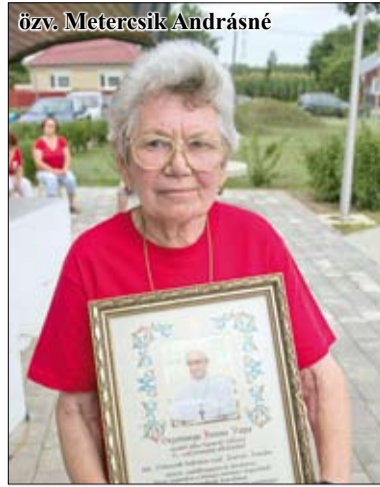
Az egyháztagek meghatódva fogadták a köszöntést