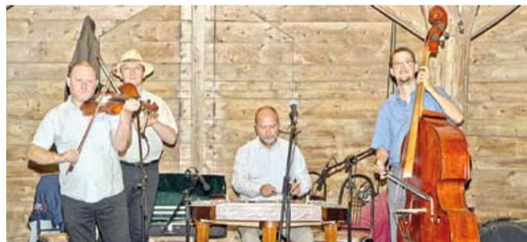
Ismét visszatért a Tükrös Zenekar a Tékába