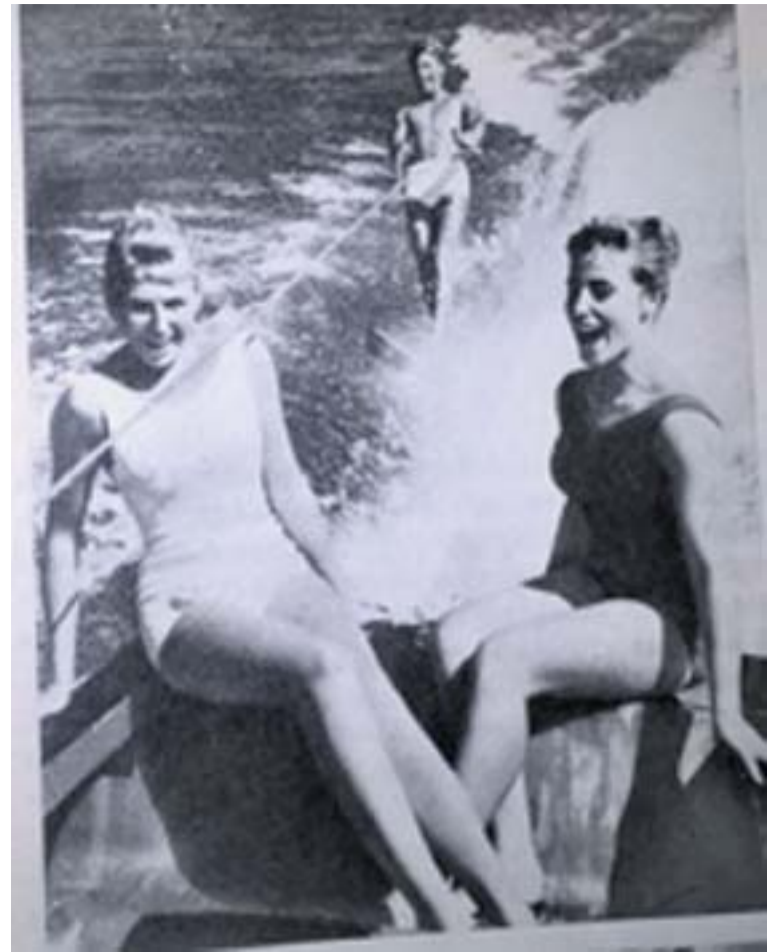
Az ausztrál fiúk és lányok kedvenc sportja a vízisíelés. (Ez nálunk pont 10 évre rá jött igazán divatba)