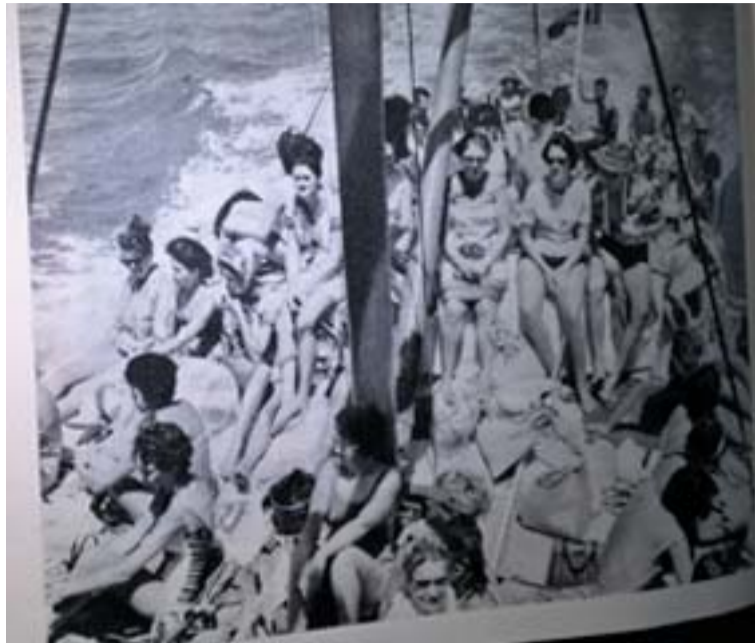
Vitorlás hajó viszi a turistákat a Nagy- Korallgát szigeteire (Szegény korallzátony... manapság haldoklik, „levegő után kapkod”)

Arra gondoltam talán nem csak nekem „édes olvasmány” egy 1966-ból való összegzés, az akkori Ausztráliáról és az ott élő nőkről.