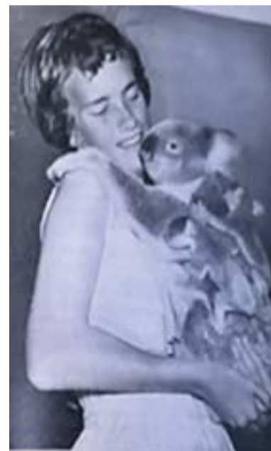
A lovat betörő ausztrál nő? A koala viszont hátán a csemetéivel, örök téma úgy látom.

A nők nagy része egyáltalán nem vállal munkát. Az ausztrál férfiak nem nézik jó szemmel, ha egy asszony dolgozik. .... az összes dolgozóknak mindössze 3-8%-a nő.