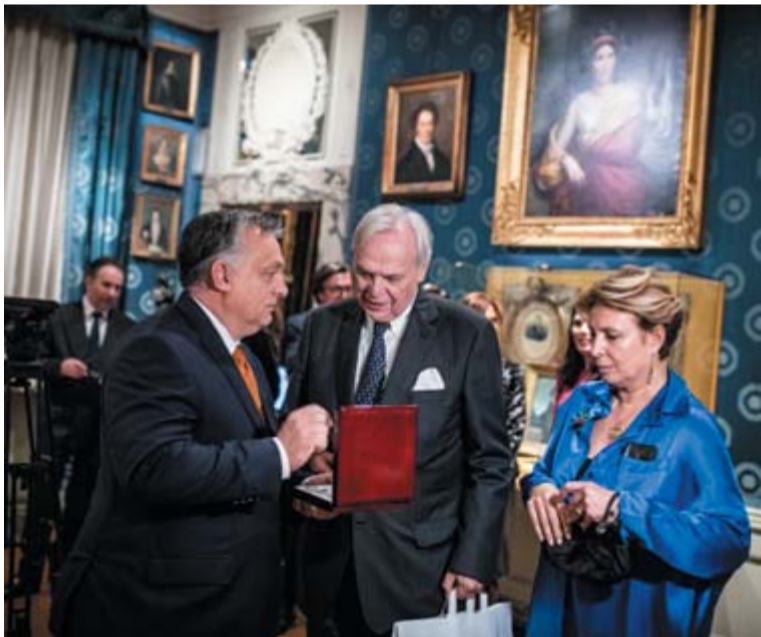
Magyarország képviseletében Orbán Viktor miniszterelnök is részt vett Kurtág György első operájának bemutatóján

A Kossuth-díjas magyar zeneszerző Samuel Beckett 1957-ben Párizsban bemutatta A játszma vége című abszurd drámáját zenésítette meg.