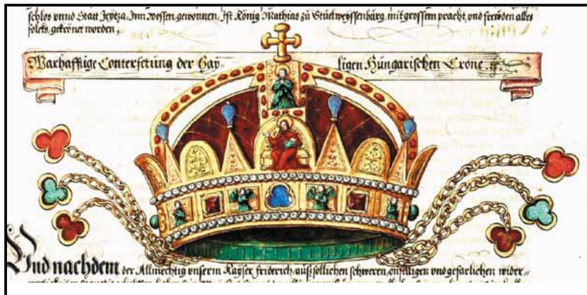
A Szent Korona legrégebbi hiteles ábrázolása 1555-ben

Ám a Szent Korona szerepe nagyobb és teljesebb, mint pusztán a tárgy története a születéstől a Parlament kupolaterméig. A magyar koronának a megannyi válságban, trónviszályban, háborús katalizmában réges-régen el kellett volna pusztulnia. Nagy és erős