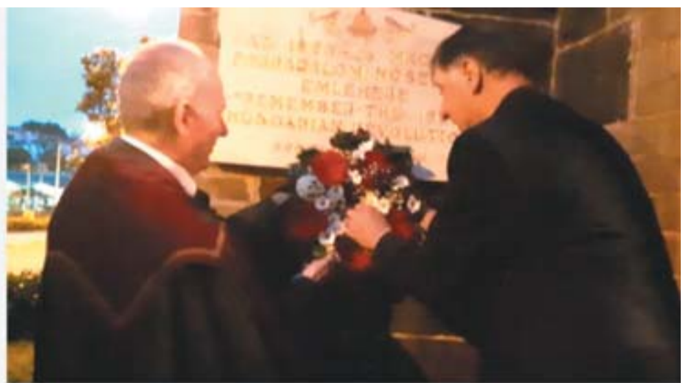
Koszorúzás a Templom falán lévő 56-os Forradalom Emléktáblájánál