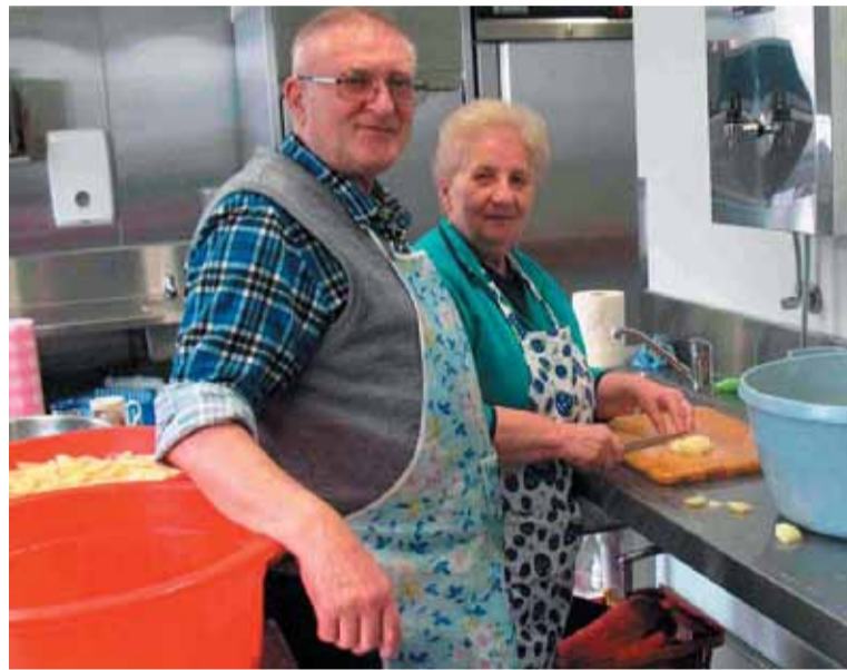
A konyhai munkatársak