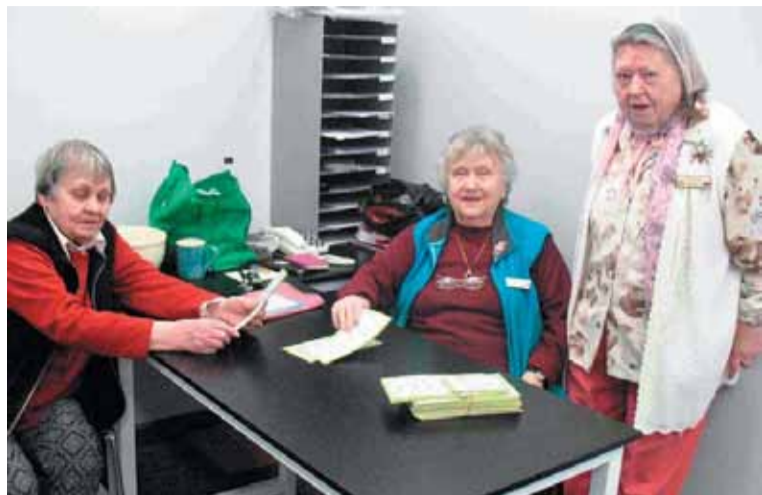
A főnök asszony két segítő társával