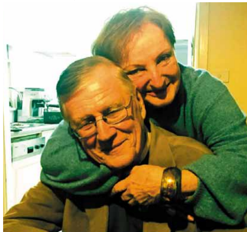
Feleségem, Cilu kajaiban

déglőben megebédeltettek – emlékeztetőül közelgő születésnapomra –, mielőtt leadtak Szentendrén, ahol lányoméknál, készülve a sydneyi utazásra, postára adtuk a begyűjtött három doboz könyvet. Manapság már nincs hajóval szállítás, minden légi úton történik, s így a könyvek feladása többre került, mint azok vásárlási értéke.