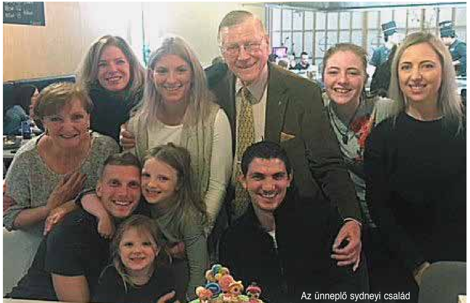
Az ünneplő sydneyi család

Mindhárom előadás a magyar nyelv tanításának korszerűsítésével foglalkozott, mind nyelvészeti, mind adminisztratív vonatkozásban. Sokat tanultunk az előadottakból. Mindhárom előadás kézírata birtoklomban van.