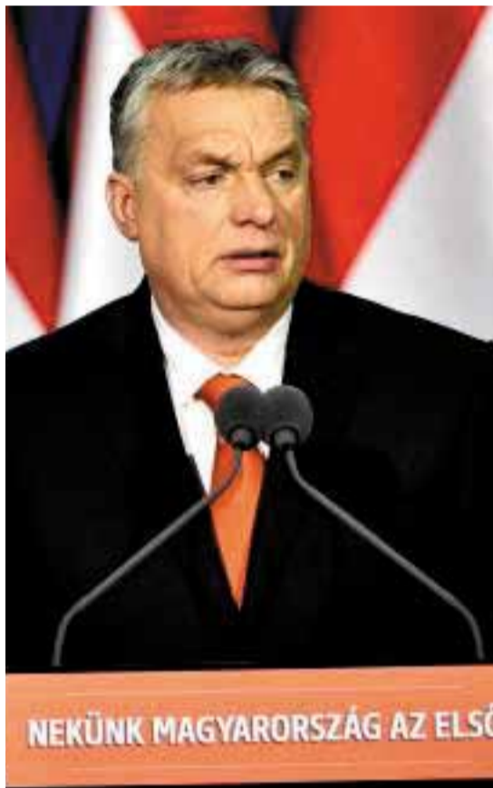
NEKÜNK MAGYARORSZÁG AZ ELSŐ

ország függetlenségét elérték, de az nem olyan, mint a lekvár: nem áll el a polcon, időről időre meg kell védeni. Azt kérte: senki ne feledje, nem szabad az ország sorsát az internacionalisták kezébe adni.