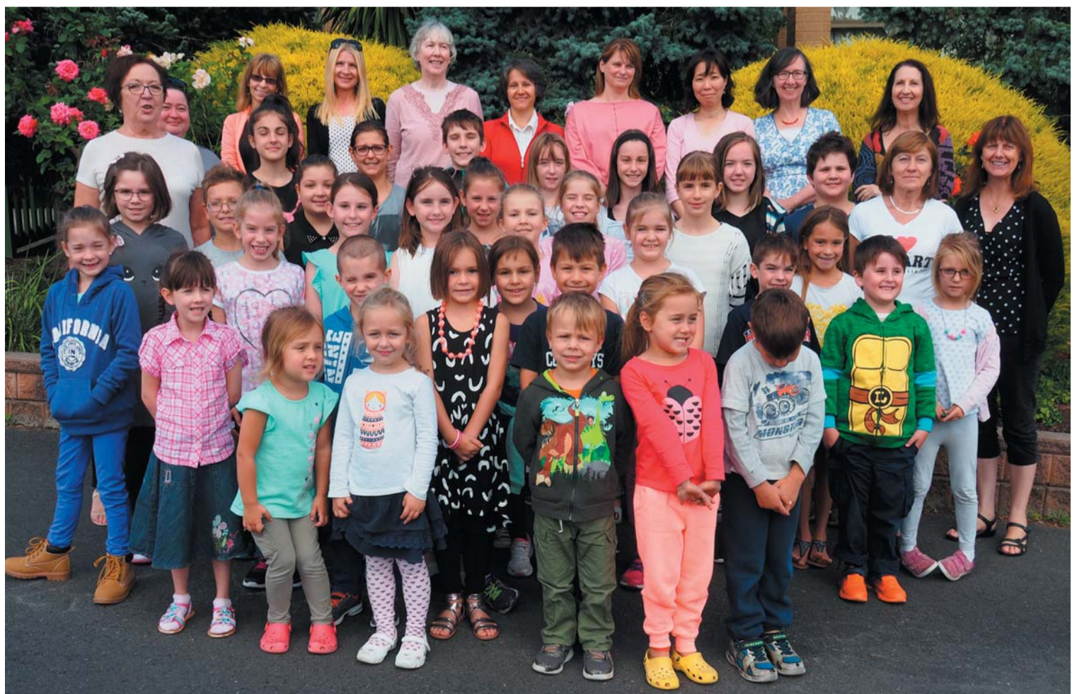
Melbourne-i Magyar Iskola 2017-es tablója