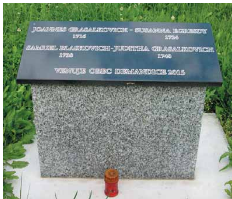
Az emléktábla a Hébeci templom melletti temetőben