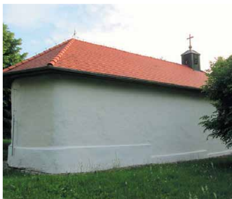
A Hébeci templom ablaktalan oldala