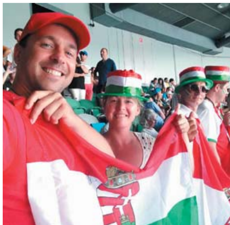
Szurkolás a Fucsovics-Federer meccsen