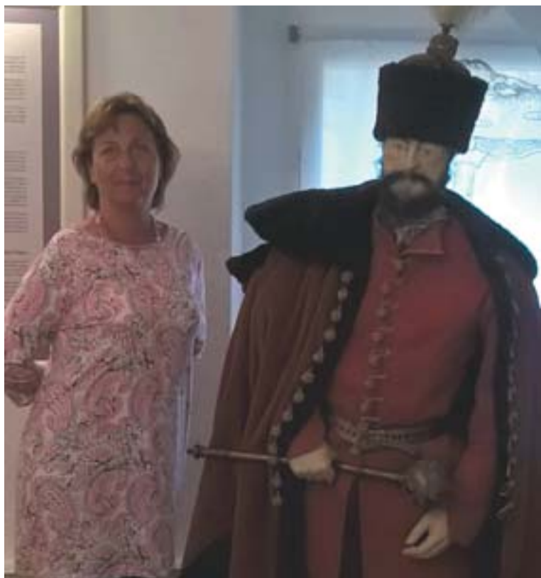
Két „kor” találkozik, a szerző és egy „ős”.

Január-27. szombat (d.e): Magyar közösségi találkozó az Adelaide-i Református Egyház szervezésében.