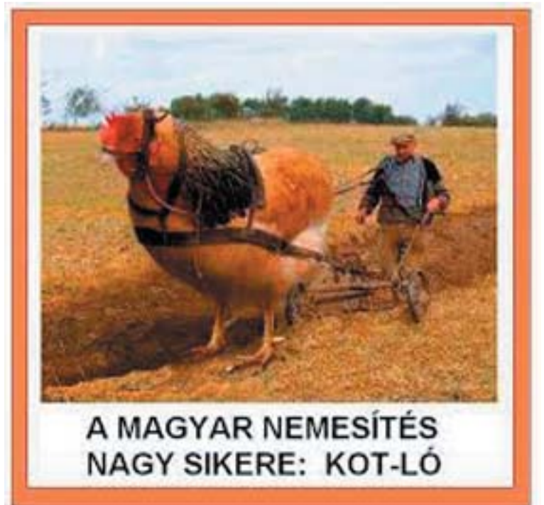
A MAGYAR NEMESÍTÉS NAGY SIKERE: KOT-LÓ

— Néma, szőke, nimfomániás és az apjának van egy jó kis sörözője.