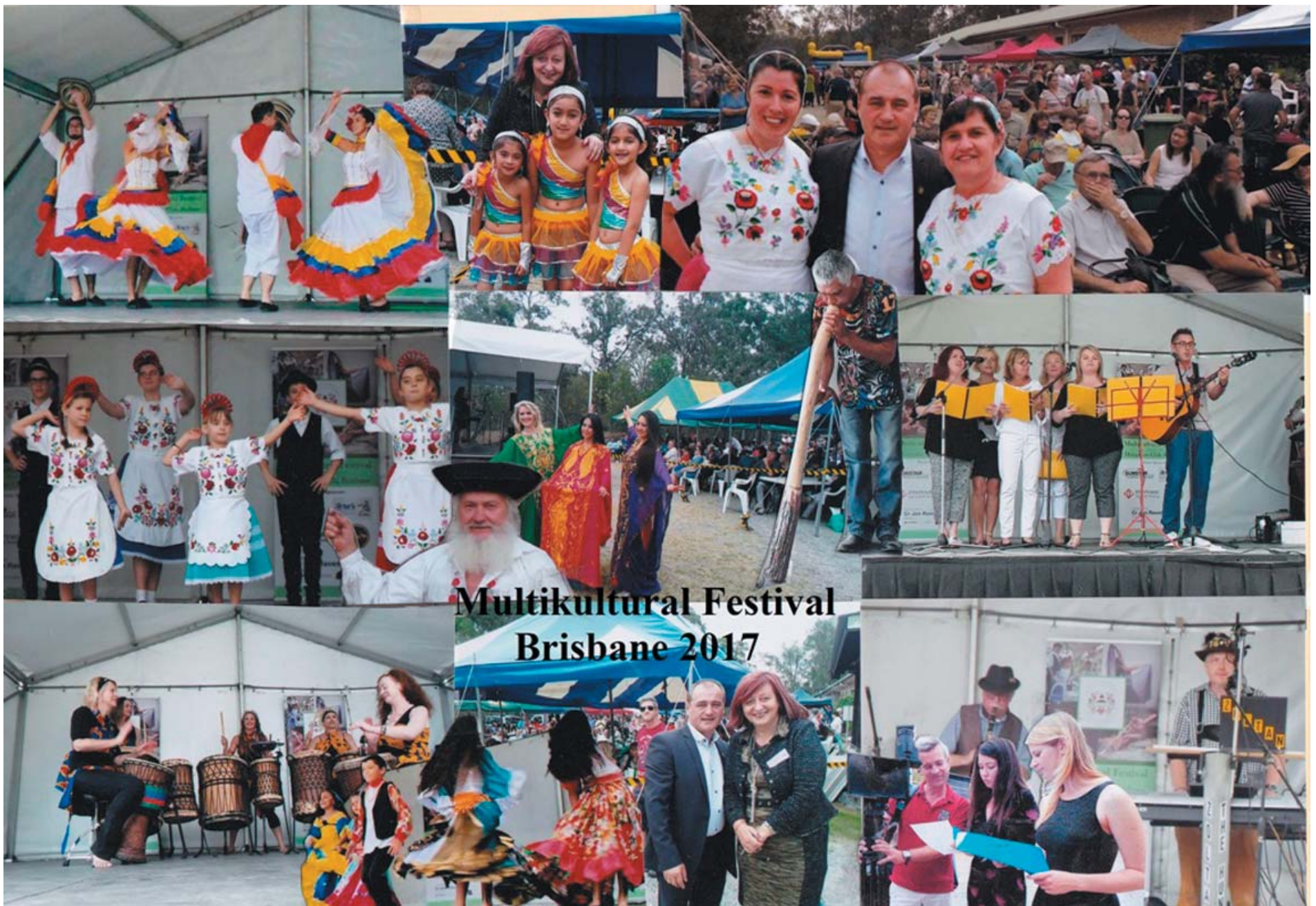
Multikultural Festival Brisbane 2017