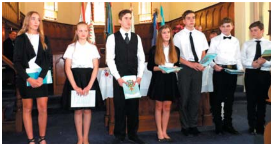
Konfirmálás után, kezükben a Biblia és a Konfirmáló okmány.