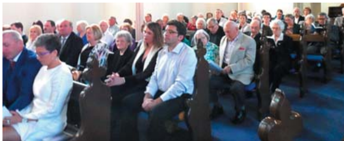
Az Emlékünnepi Istentisztelet gyülekezetének egy része