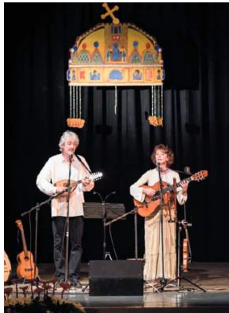
Csorna város Szent István ünnepén