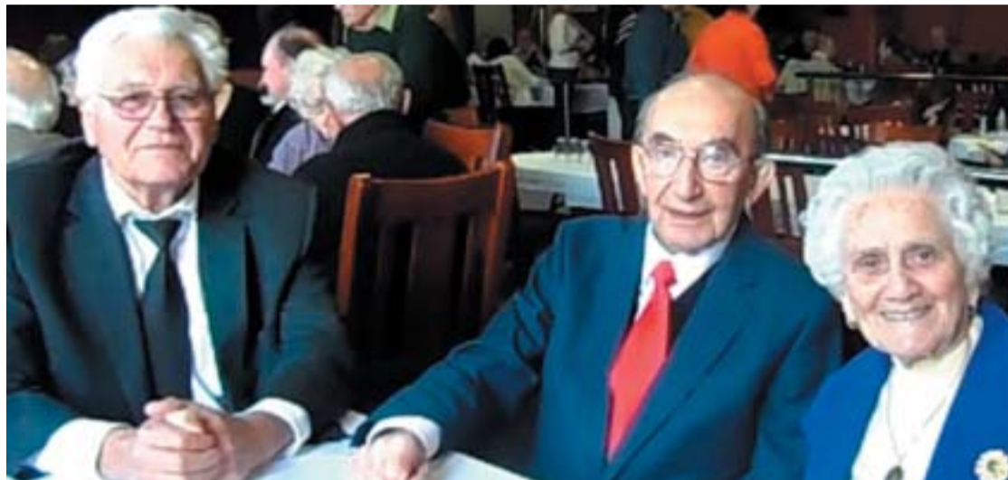
A Hidas házaspár és barátjuk a Disznótoros Ebéd után