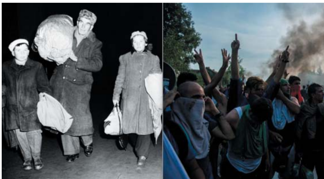
Menekültek 1956-ban és migránsok 2015-ben

A korábban Orbán Viktort visszataszító módon támadó brüsszelita vezér ezzel újra elővette a nyugati liberálisok körében időnként előbukkanó agyrémet, amikor az 1956-os magyar menekülteket összemosták napjaink migrációjával. Egyetlen fotómontázzsal reagálnánk Frans Timmermans blódségére.