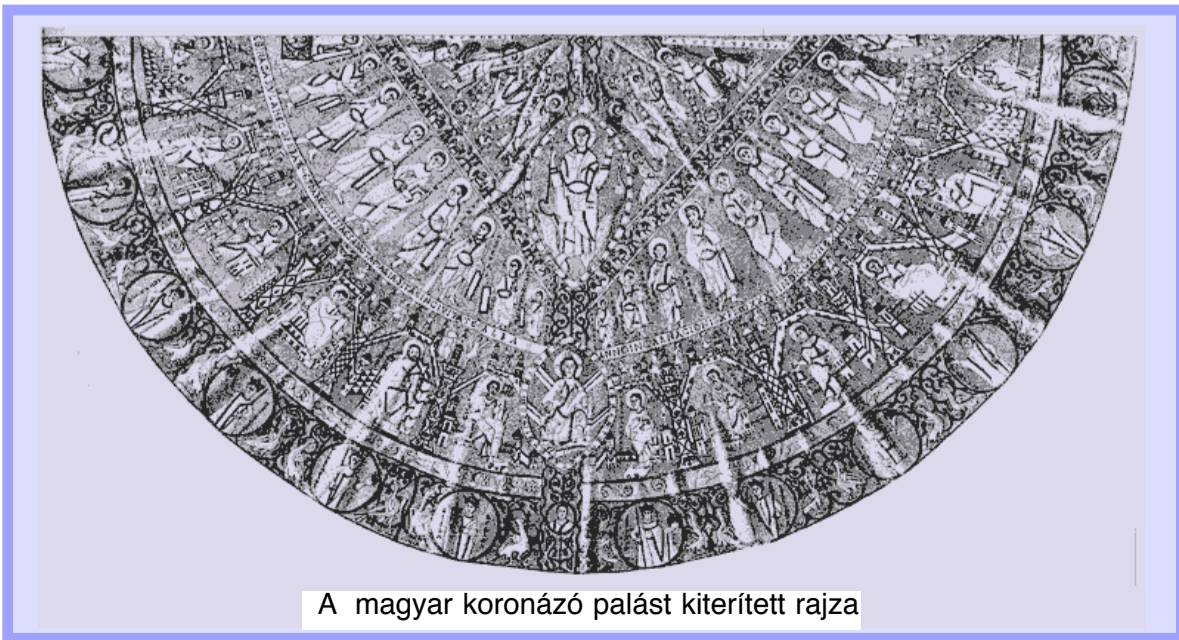
A magyar koronázási palást kiterített rajza