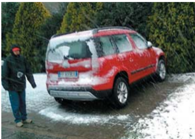
Tájkép: Magyarország 2017. április 17.

Beszédében megemlékezett Péchy Blanka színésznőről, nyelvvelőről,