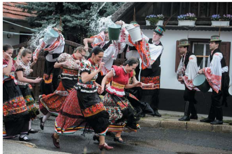
A Matyó Népművészeti Egyesület húsvéti bemutatója Mezőkövesden

A pesti oldalon a Múzeum körúton, az Üllői úton, a Kerepesi úton és a Népszínház utcában forgalomcsökkenéssel számolnak. Ez idő tájt a budai és a pesti alsó rakpartokon víz-, illetve gázcsöveket cserélnek, viszont ezek a munkák július közepéig várhatóan befejeződnek.