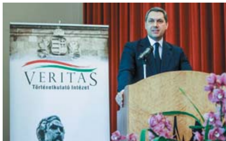
Lázár János a Veritas konferenciáján

A Magyarország sorsfordító esztendő: Kállay Miklós miniszterelnökségének mérlege című konferenciát a Veritas Történetkutató Intézet, valamint a Magyar Mezőgazdasági Múzeum és Könyvtár szervezte. A rendezvényen részt vett a Kállay-család több tagja.