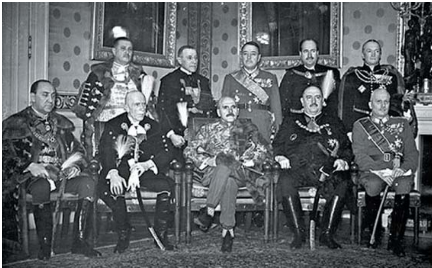
Az 1942. március 10-én beiktatott Kállay-kormány tagjai: (ülnek balról jobbra) Reményi-Schneller Lajos, Keresztes-Fischer Ferenc, Kállay Miklós, Hóman Bálint, Bartha Károly, (állnak) Varga József, Radocsay László, Gyórfly-Bengyel Sándor, Bánffy Dániel, Bárczy István

Hetvenöt éve alakult meg a Kállay-kormány, amelynek vezetője megpróbálta kivezetni az országot a háborúból