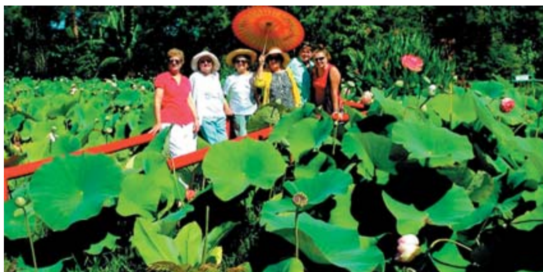
A hatalmas tavirózsák között