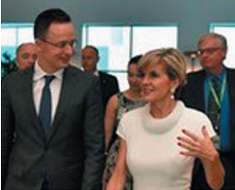
Szijjártó Péter külgazdasági és külügyminiszter és Julie Bishop ausztrál külügyminiszter az ausztrál parlament épületében, Canberrában

Ausztrália és Magyarország migrációs politikája teljesen megegyezik, ezért Magyarország határozottan támogatja Ausztrália tagságát az ENSZ Emberi Jogi Tanácsában — jelentette ki Szijjártó Péter külgazdasági és külügyminiszter az MTI-nek telefonon nyilatkozva szerdai canberrai tárgyalásai után.