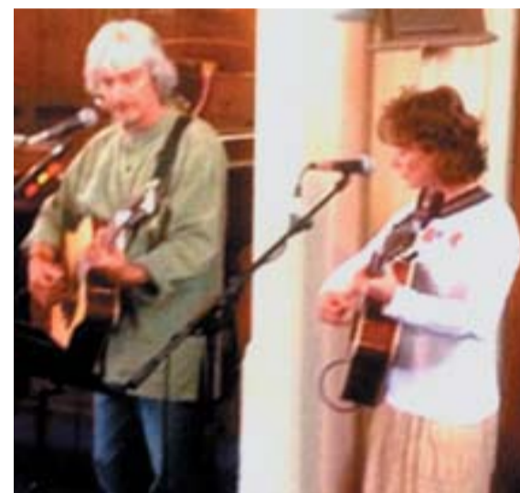
A Hangraforgó Együttes a vasárnapi Istentiszteleten

Minden hó első vasárnapján Presbiteri Gyűlés.