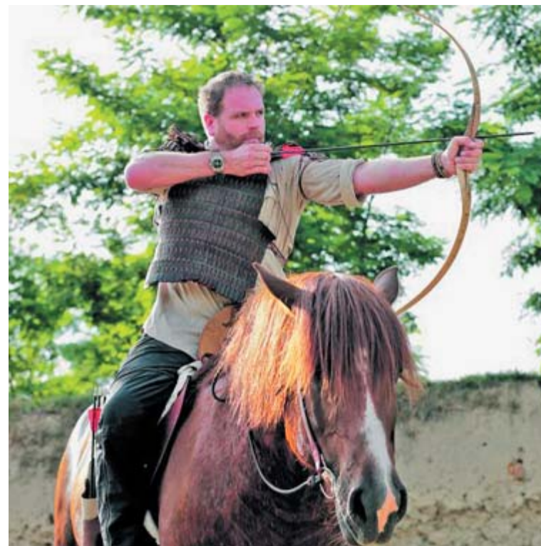
A műsorvezető a lovas íjászatot is kipróbálta a magyarországi forgatáson